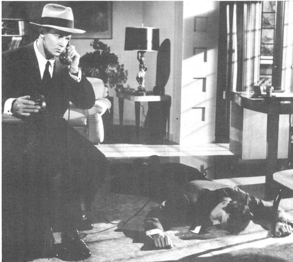
SHOCKPROOF, Douglas Sirk (Drehbuch Samuel Fuller)