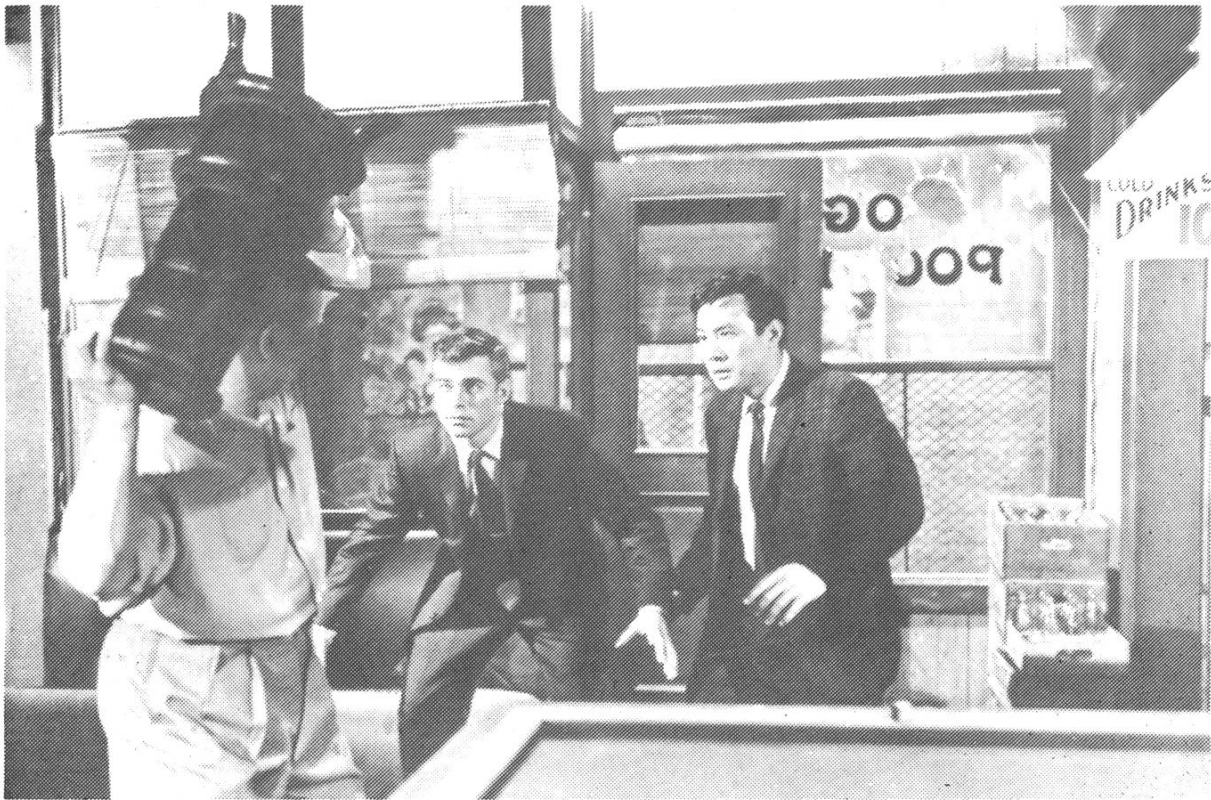
THE CRIMSON KIMONO, Samuel Fuller