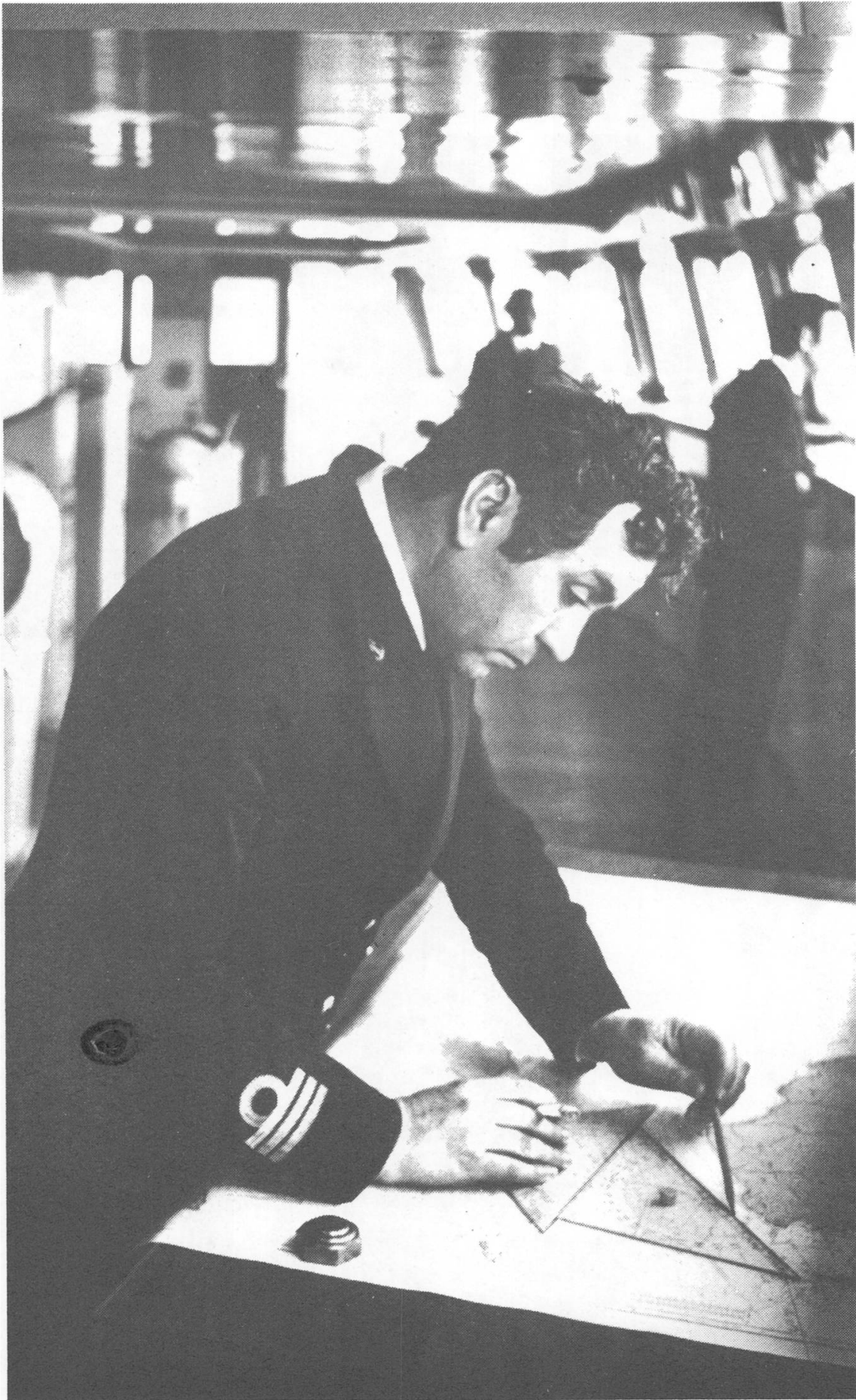
Reko-Foto zum Projekt "Transit"