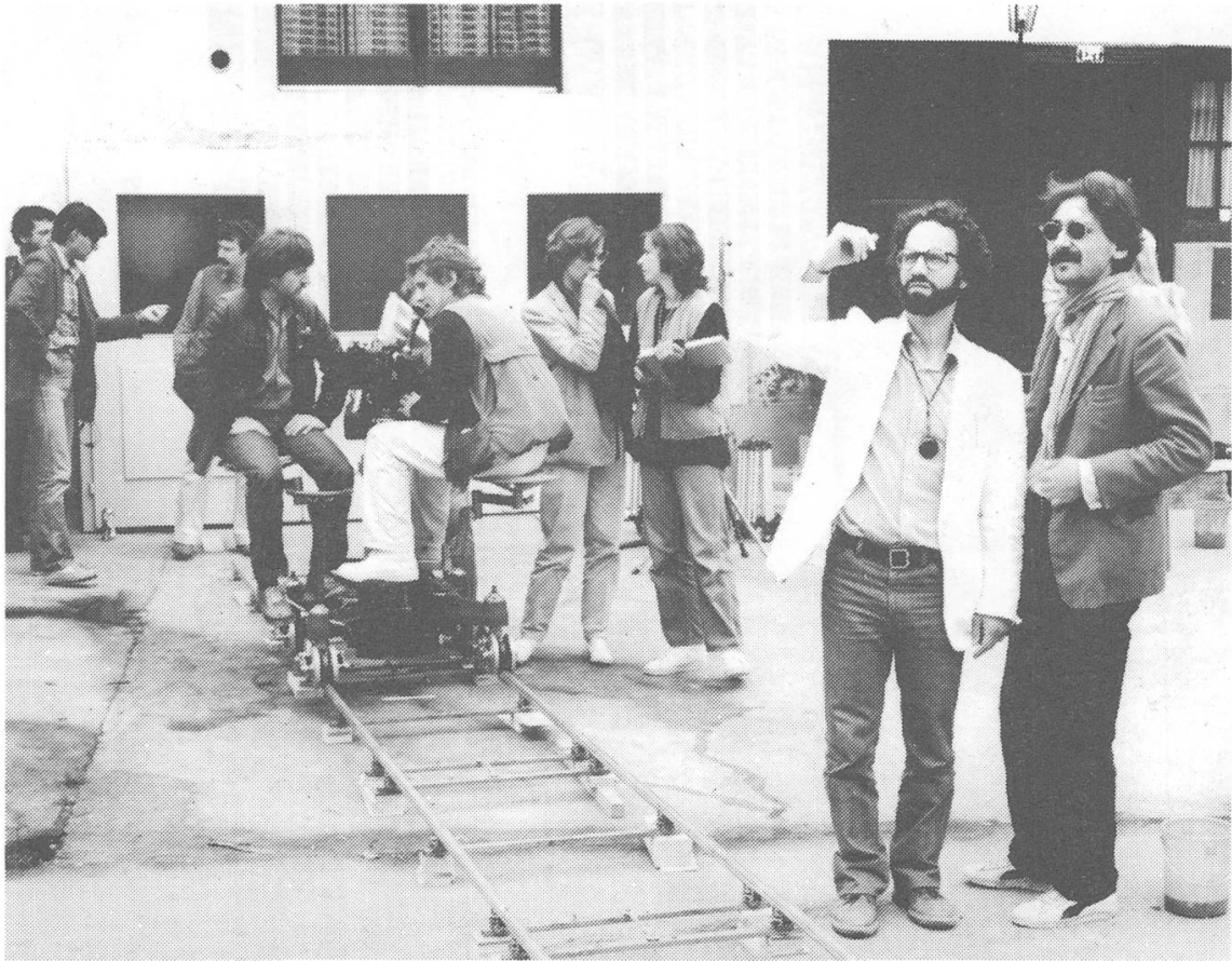
Dreharbeiten zu DAS BOOT IST VOLL