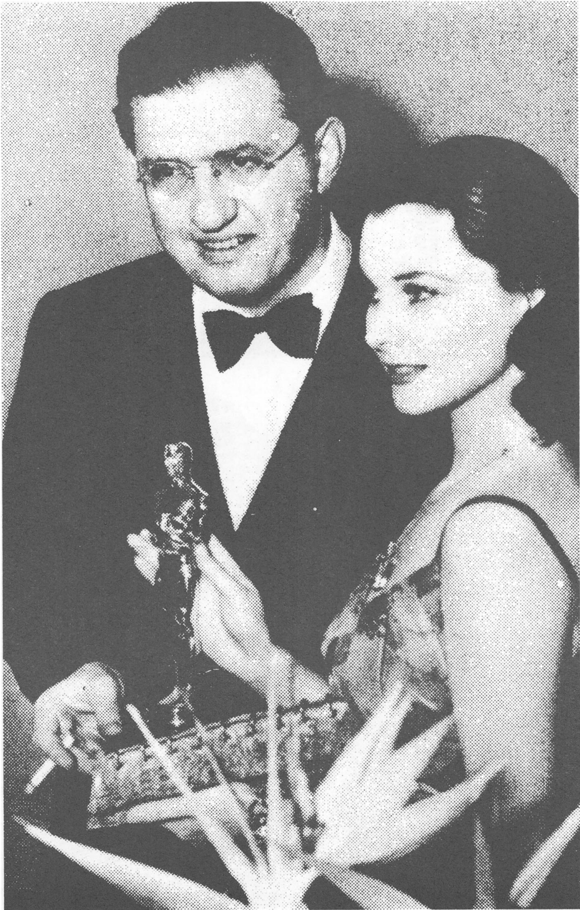
David O.Selznick und Vivien Leigh bei der Uebergabe der div. Oskars für GONE WITH THE WIND