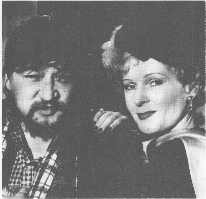
Sybille Schmitz | Rainer W. Fassbinder und Rosel Zech