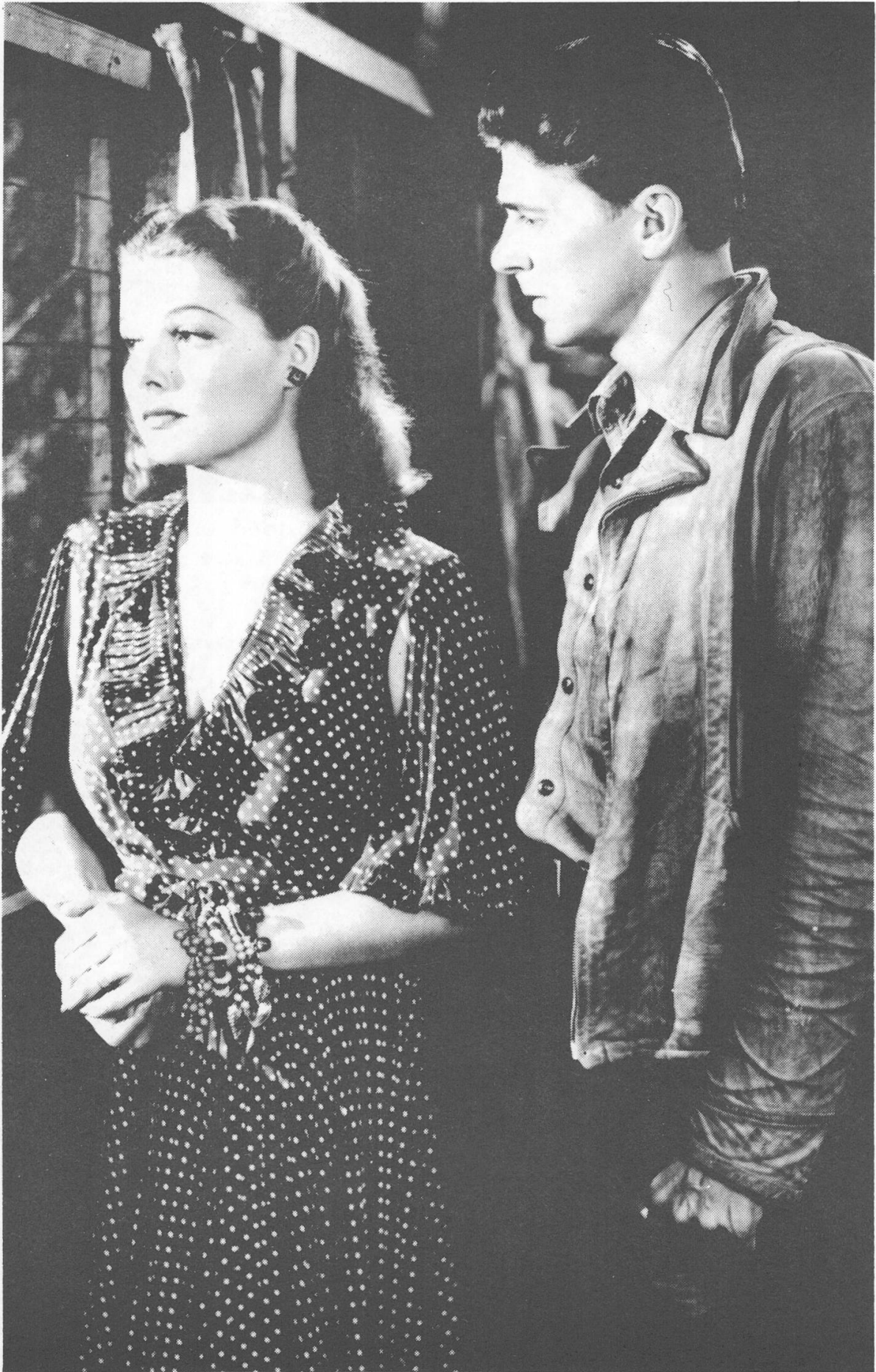
Ronald Reagan und Ann Sheridan in JUKE GIRL (1941)