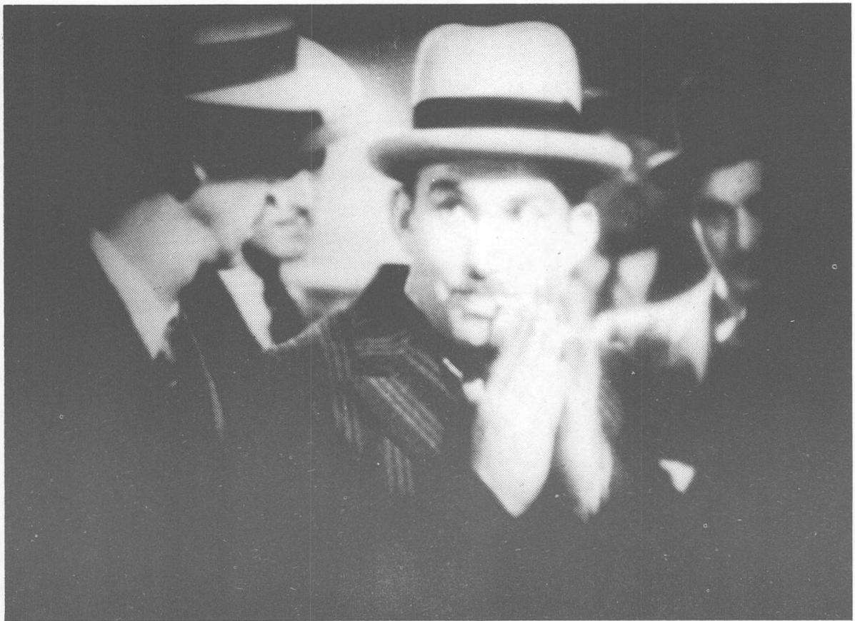
Bleistift statt Pistole: "It's business and we are going to run it like a business." - Angelo - ein herrlicher, ein köstlicher Vince Barnett - zum Kugeln komisch, leidgeprüft als "Mister Camontes Secretary" am Telefon.