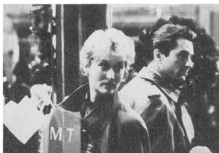
Zerwürfnisse mit dem Ehepartner ...