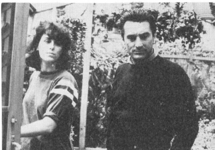
zärtliches Beisammensein ...