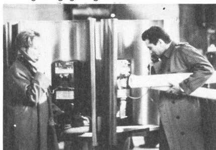
Zufällige Begegnungen ...

vorgesehenen Geschenke zu vertauschen. Nachdem sie nun auf der Treppe des New Yorker Bahnhofs geklärt haben, warum seine Ehefrau ein Segelbuch unter dem Christbaum fand und ihr Ehemann einen Gartenbauband, trennen sie sich wieder. Aber nicht für lange: Das Drehbuch, phantasievoll wie ein Ordner voll alter Rechnungen, lässt sie immer wieder zufällig zusammentreffen, bis sie schliesslich das tun, was uns der Titel schon offenbart. Sie verlieben sich. Doch als sich das Paar nach vielen Apéro-Treffs endlich umarmt und aufs Bett sinken will, machen uns viele Grossaufnahmen klar, wo das Hindernis steckt: am Finger. Beide sind verheiratet - was nicht oft genug betont werden