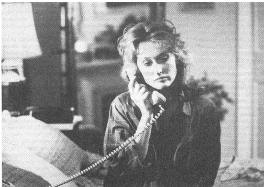
Meryl Streep als Molly Gilmore