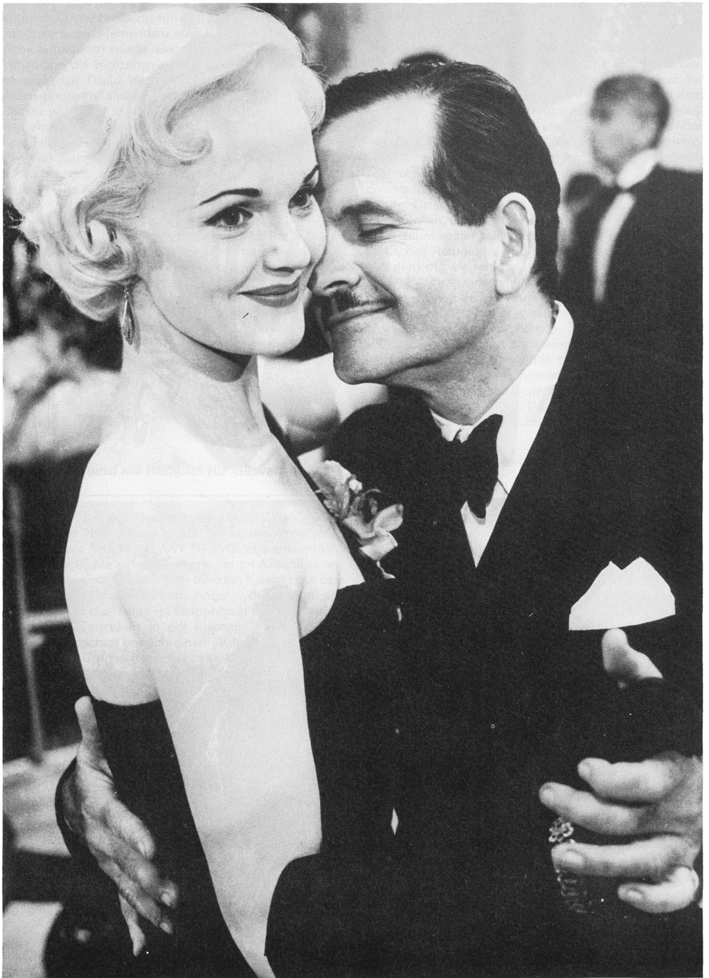
DANCE WITH A STRANGER