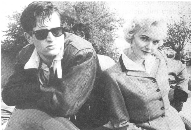
DANCE WITH A STRANGER