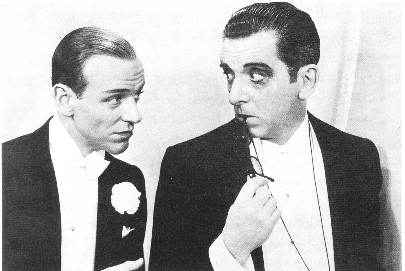
Fred Astaire und Edward Everett Horton in TOP HAT