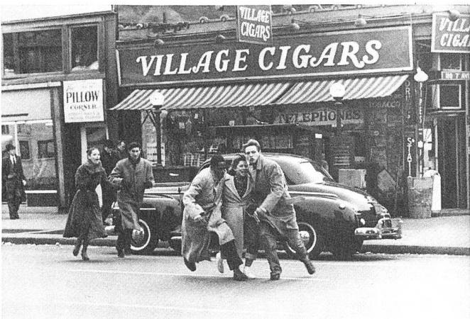
NEXT STOP GREENWICH VILLAGE