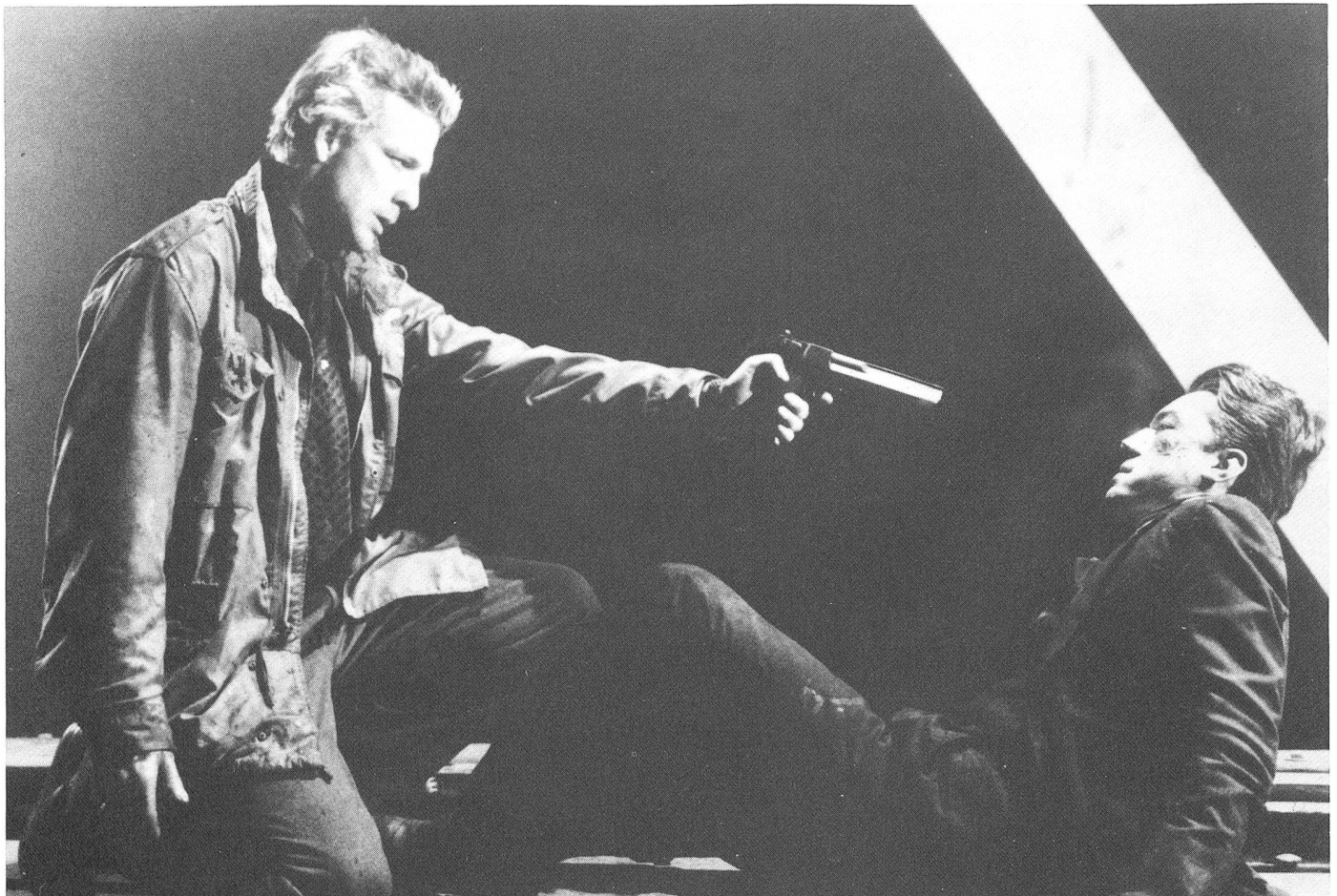
Mickey Rourke als Stanley White in THE YEAR OF THE DRAGON von Michael Cimino