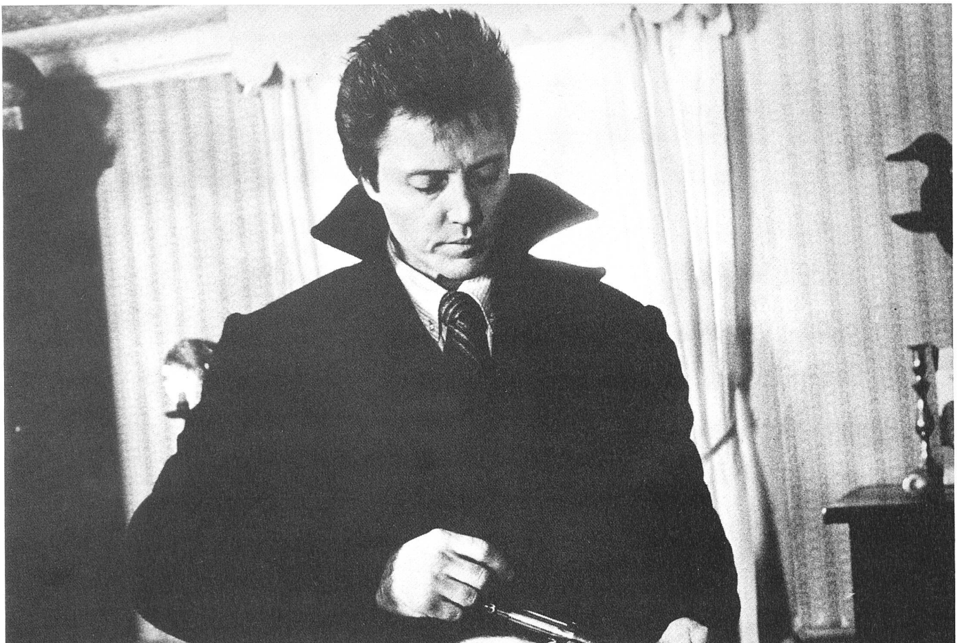
Christopher Walken als Johnny in DEAD ZONE