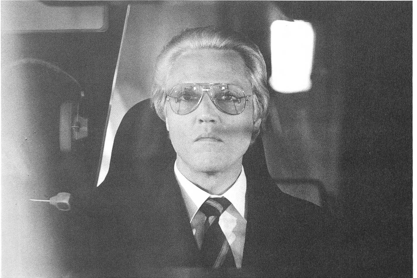
Christopher Walken als Max Zorin im Bondfilm A VIEW TO A KILL