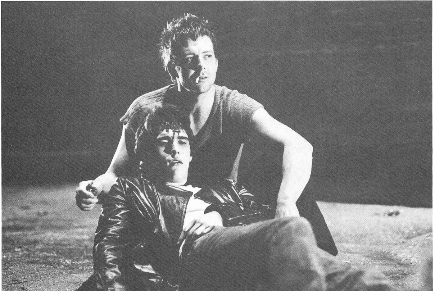
Mickey Rourke als Motorcycle Boy in RUMBLE FISH von Francis Ford Coppola