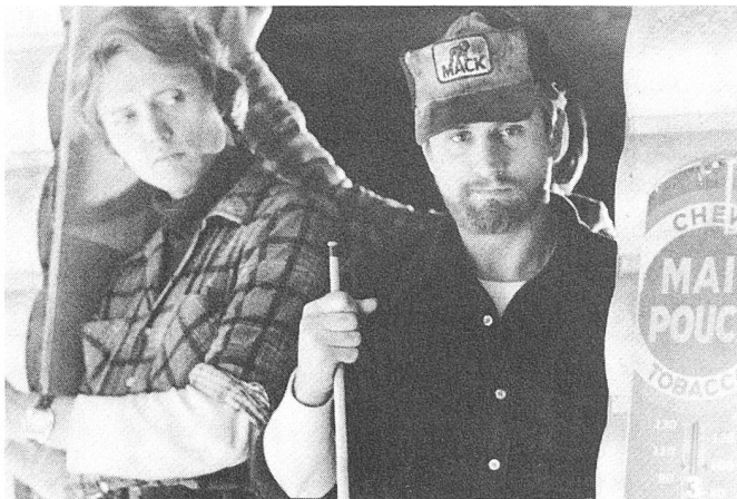
Christopher Walken und Robert De Niro in THE DEER HUNTER