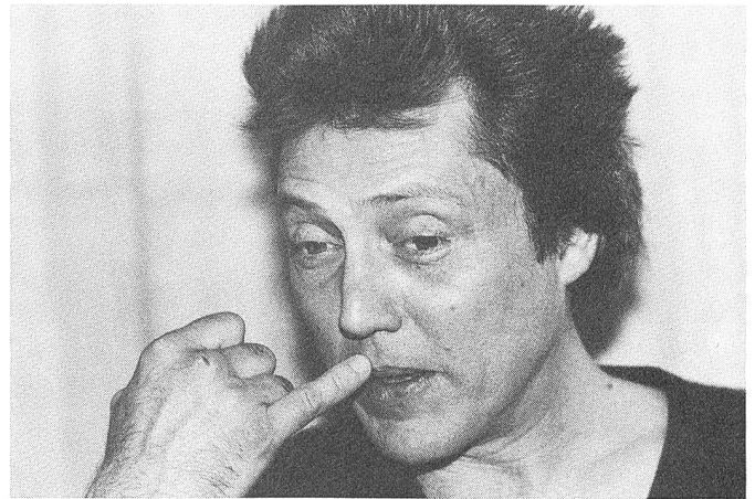
Christopher Walken , geboren am 31. März 1943