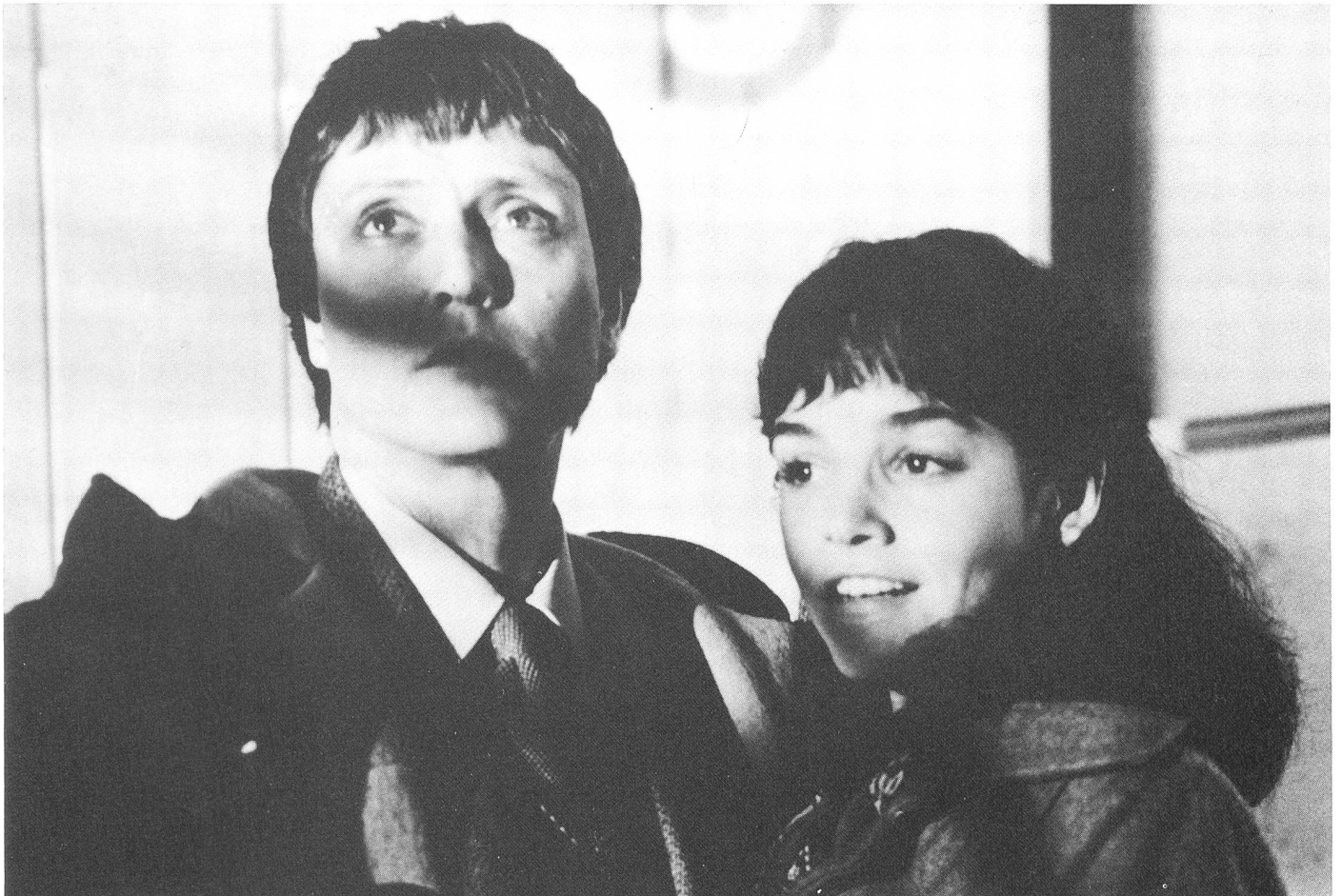
Christopher Walken und Brook Adams in DEAD ZONE von David Cronenberg