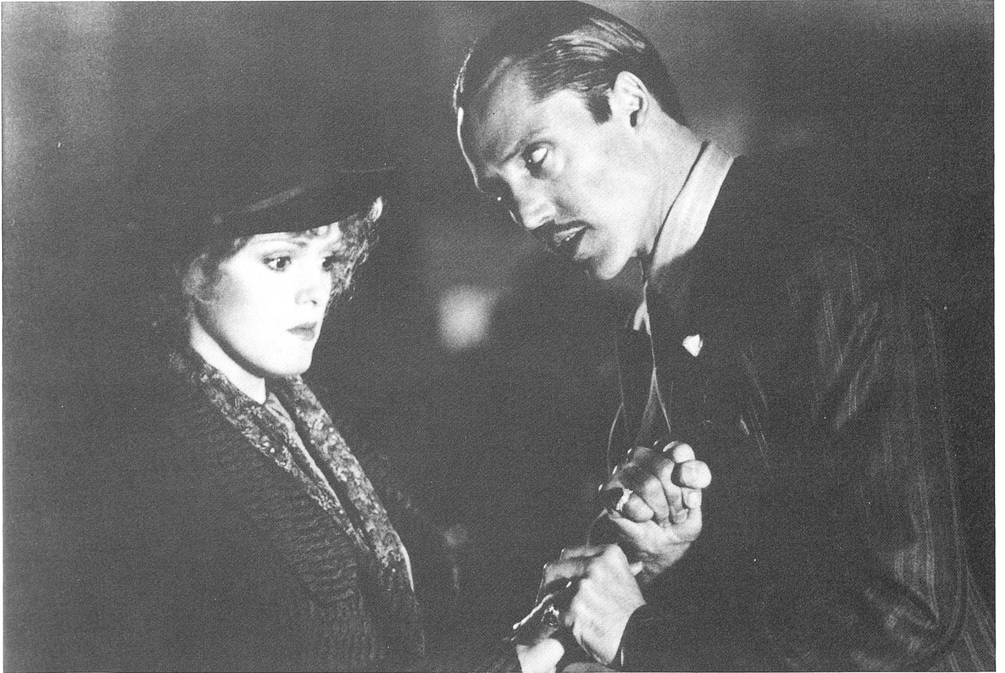
Christopher Walken als Tom in PENNIES FROM HEAVEN von Herbert Ross