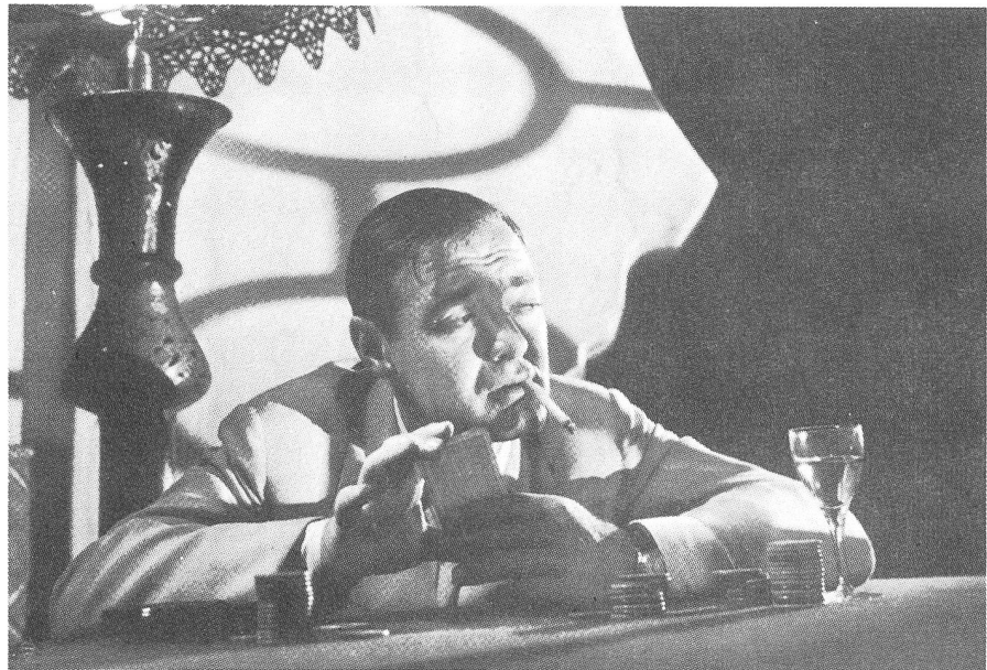
Peter Lorre in CASABLANCA (1942)