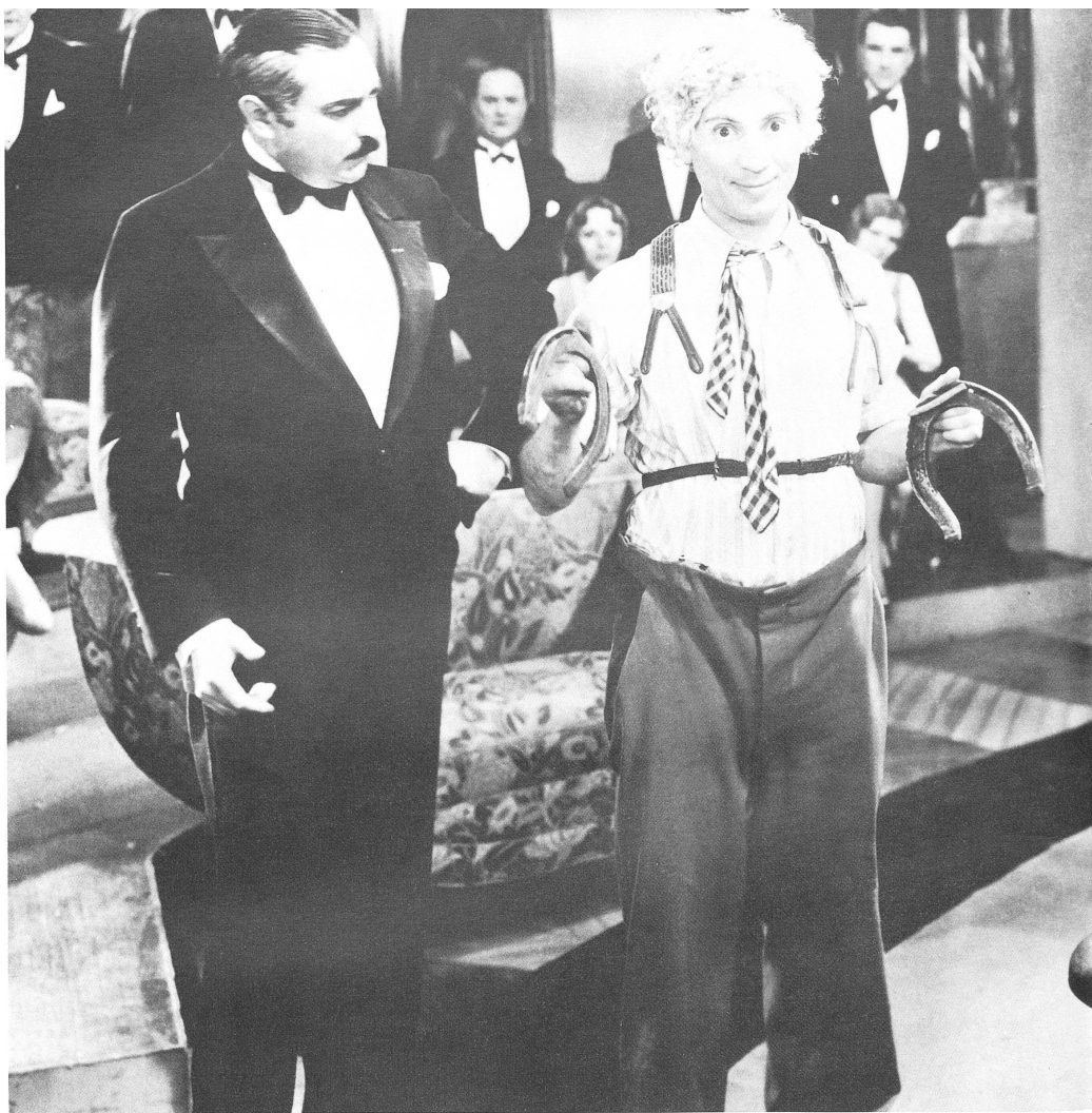
Nein sie scheren sich nicht um Gesetze und Regeln, von Fairness gar nicht zu reden.