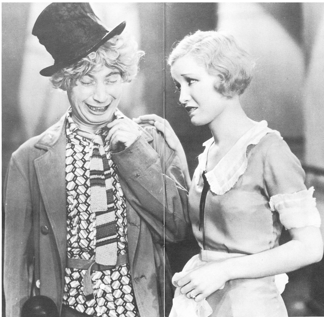
Harpo wird mit einer Schere tätig und haut alles ab, was an Status und Prestige gemahnt: Krawatten, Frackschösse, Cigarren, Federn. MONKEY BUSINESS