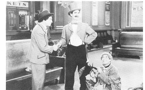
GO WEST (1940)