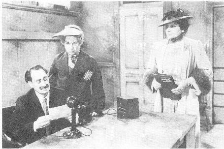
THE BIG STORE (1941)