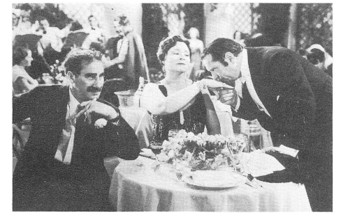
A NIGHT AT THE OPERA (1935)

Die Marx Brothers in Hollywood? Mit THE COCOANUTS, ANIMAL CRACKERS und MONKEY BUSINESS sind drei der fünf Paramount-Filme gedreht. Was noch folgt, sind jene beiden, die Groucho später den College- und den