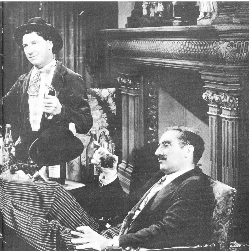
«Whatever it is, I am against it», singt Groucho an anderer Stelle, und es hört sich an wie ein Bekenntnis seiner Lebensphilosophie.

Von der Bildung, die auf dem Huxley College gelehrt wird, halten die Marx Brothers nichts. Groucho, von einer Phalanx bärtiger Professoren umgeben, ist der neue Rektor, Professor Wagstaff. Er steht hinten auf der Bühne und rasiert sich, als im Saal schon das ganze College sich festlich versammelt hat. Und weil das Rauchen streng verboten ist, hat er auch gleich eine Cigarre im