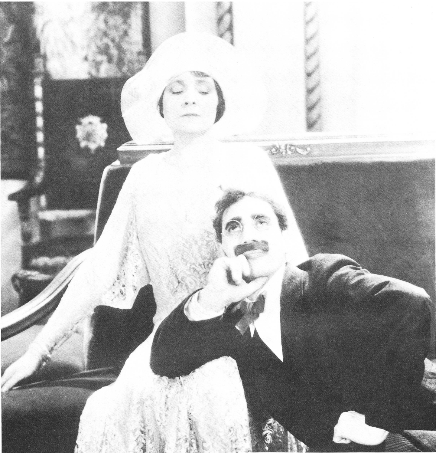
Groucho, mit seinem angemalten Schnauz, macht's mit Sätzen, mit der Stimme, mit Wörtern. Er tut sich keinen Zwang an, auch in der Society nicht.

Ein Blick in zwei alte Zeitschriften? Eine Nummer des «Time»-Magazin, 31. Dezember 1951. Auf der Titelseite, rotgerandet, Groucho Marx in einer Porträtzeichnung. Launig-forscher Blick, sich lichtendes Haar und Nickelbrille, die Cigarre aus dem Mund ragend. Die Bildlegende: «Markenzeichen: Unverschämtheit». Er soll's – gerahmt – zu Hause aufgehängt haben. Die Huldigung im Innern des Heftes – eine Seite, «Personality» betitelt – ist ungezeichnet, handelt mehr von Grouchos TV-Quiz als von den Jahren, als die Filme reden lernten, und beginnt mit dem Satz: «Für einige Amerikaner konkretisiert sich der Name Marx in einem bärtigen Propheten der sozialen Verelendung, aber für die meisten bedeutet er ein clowneskes Durcheinander von Brüdern.»