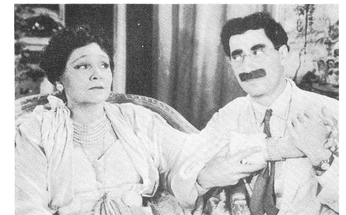
AT THE CIRCUS (1939)