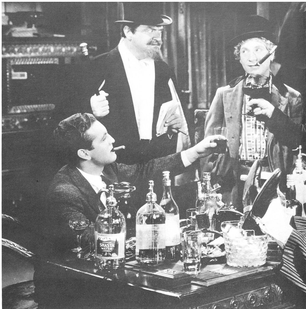
A NIGHT AT THE OPERA

HORSE FEATHERS, noch einmal mit Norman McLeod als Regisseur, hatte am 9. August 1932 Premiere. Groucho tritt als unwürdiger College-Präsident und nichtsnutziger Vater auf, der sich über seinen studierenden Sohn entrüstet: «Was soll der ganze Klatsch, dass du mit der Collegewitwe herumalberst? Kein Wunder, dass du aus dem College nie herauskommst. Zwölf Jahre in einem College! Ich ging in drei Colleges in zwölf Jahren und alberte mit drei Collegewitwen herum. Als ich so alt war wie du, ging ich gleich nach dem Nachtessen ins Bett. Manchmal ging ich vor dem Nachtessen ins Bett. Manchmal ging ich ohne Nachtessen und kam überhaupt nicht ins Bett. Eine Collegewitwe stand noch für etwas in jenen Tagen. Sie stand sogar für viele!» Schliesslich nimmt er das Leben seines Sohnes (Zeppo, wie gewohnt in der Rolle des romantischen Liebhabers) selbst in die Hand,