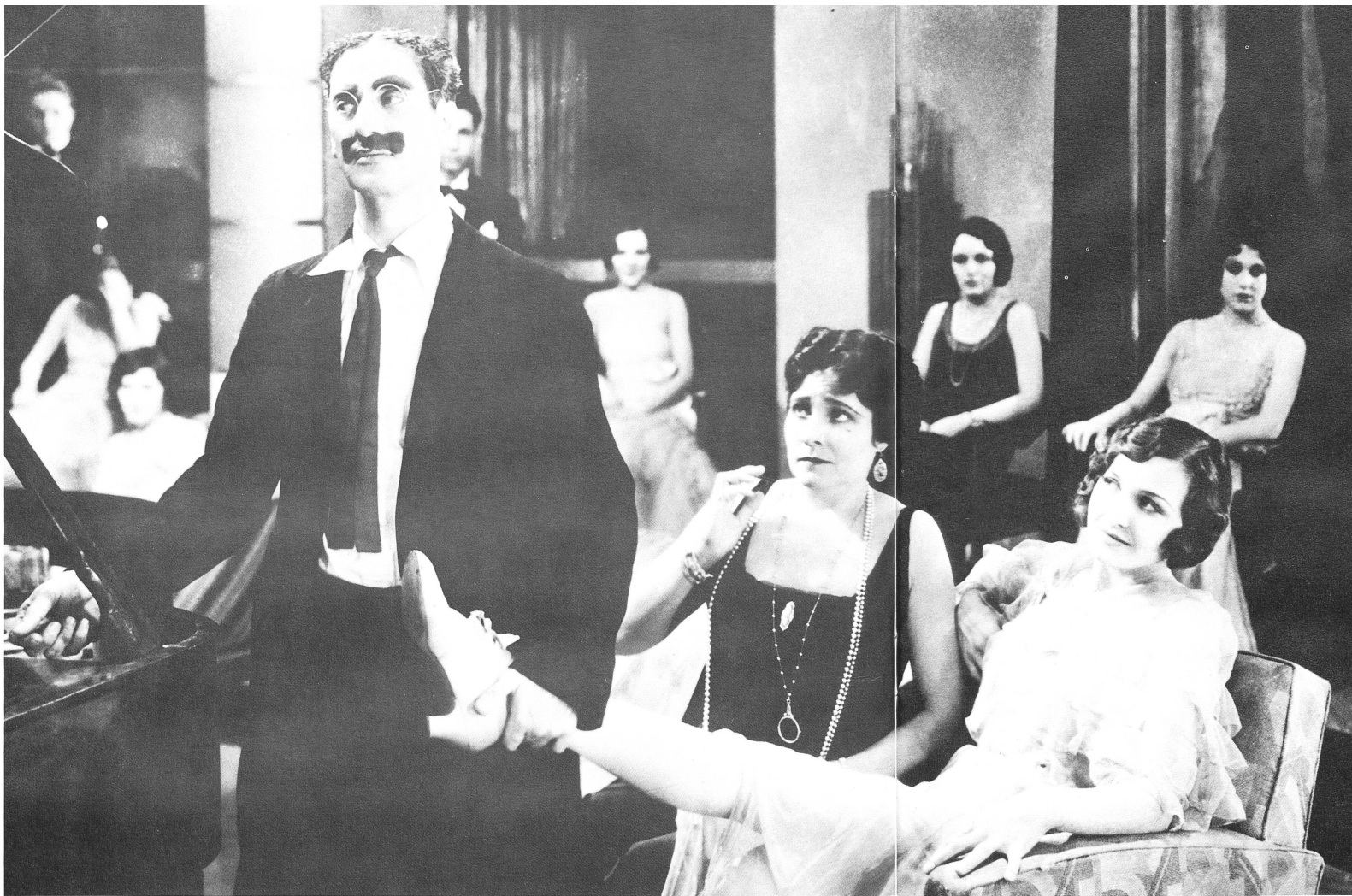
Margaret Dumont – wer sonst? – verkörperte jeweils eine stattliche Lady zwischen Millionärswitwe, Muttergestalt und Blitzableiter für unzählige Jokes.