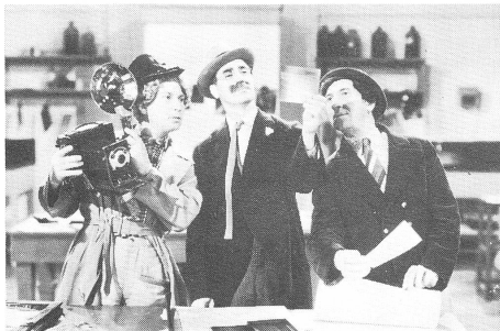
THE BIG STORE