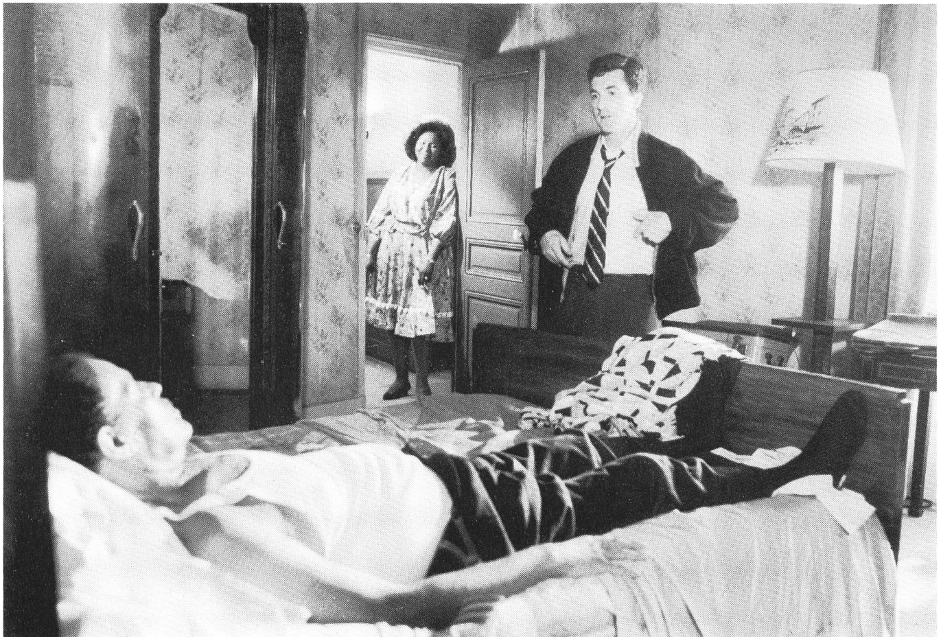
Die schäbigen Hotels, in denen die Jazzleute damals abzusteigen hatten.