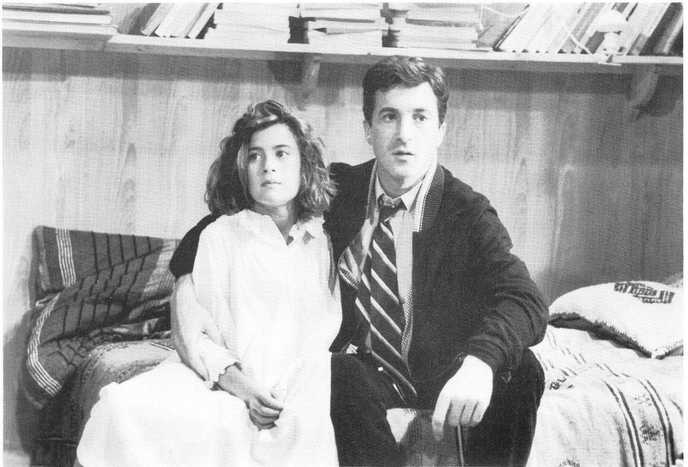
Sein Leben durch den andern leben und gerade dadurch sein eigenes zurück erhalten.

ten, den wir teilten; wir hockten da bis Bud Powell in der Nacht verschwand. Wie oft war der Jazz, bei allen Freiheitswinken, gleichzeitig eine Heimat für einen, der noch nicht 'ins Leben' hinaus wollte.»