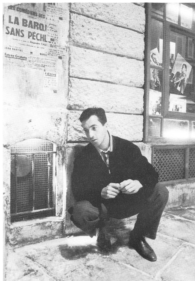
François Cluzet als Francis Borier

Den Respekt vor dieser Kultur, vor ihren schöpferischen Menschen spürt man während der ganzen Dauer des Films. Wenn beispielsweise in Francis Boriers neuer Wohnung eine Hausparty mit vielen schwarzen Gästen