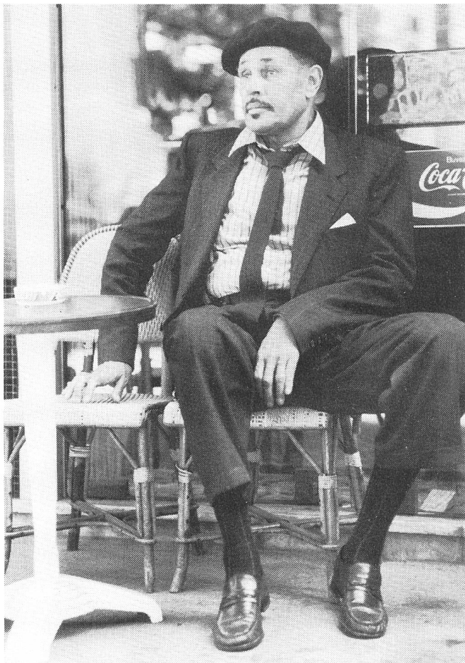
Dexter Gordon als Dale Turner

seine Mimik, seine Sprechweise, sein Rhythmus insgesamt sind ein anderer Ausdruck seiner Musik. Und so spielt die Hauptfigur in diesem Film richtigerweise und weitgehend sich selbst.