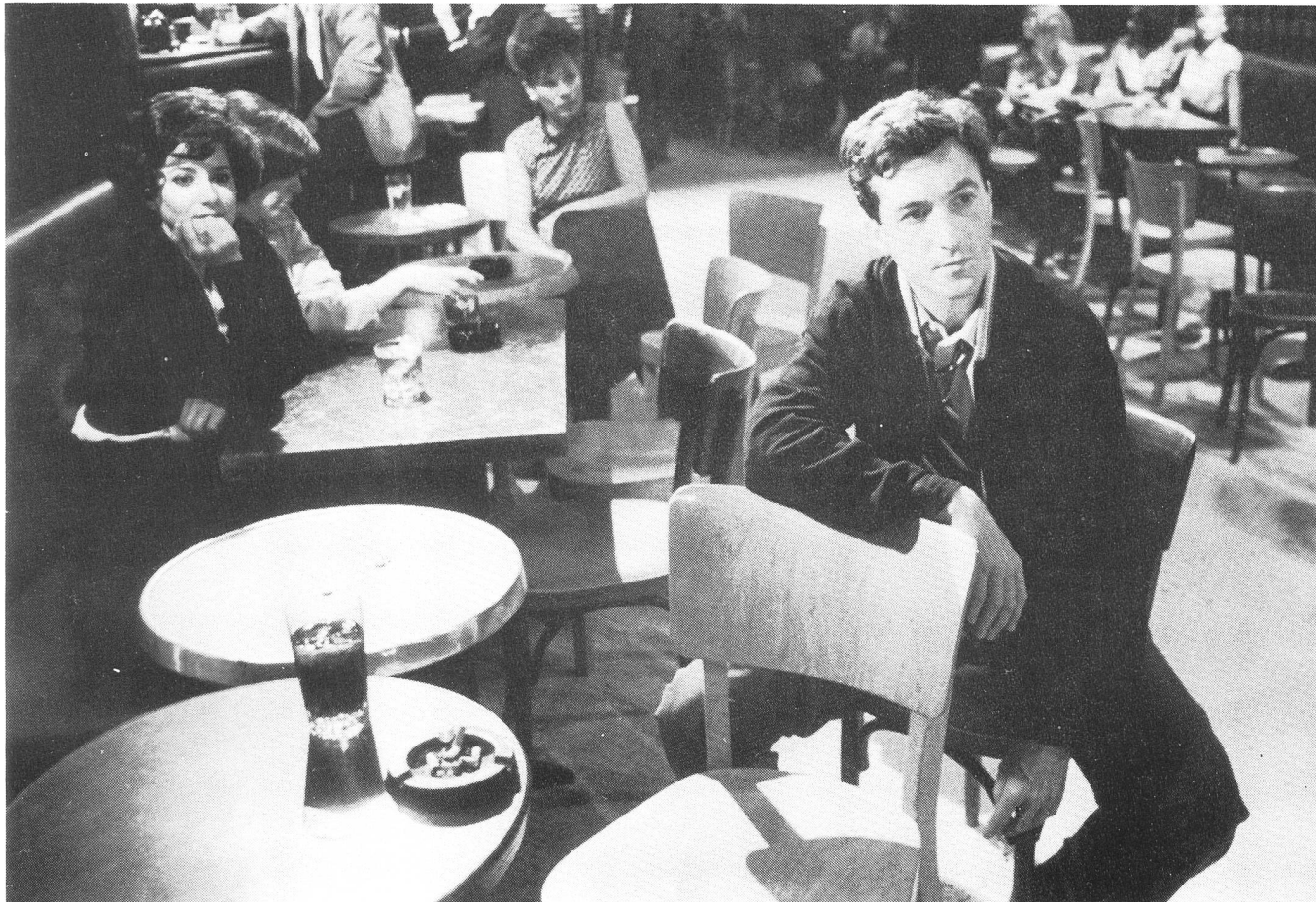
Der Nichtmusiker und Idealtypus des Jazzfans aus den fünfziger Jahren.