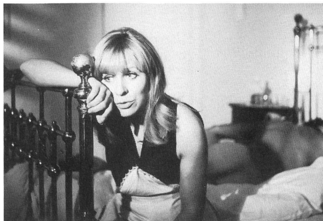
DER AMERIKANISCHE SOLDAT von Rainer Werner Fassbinder