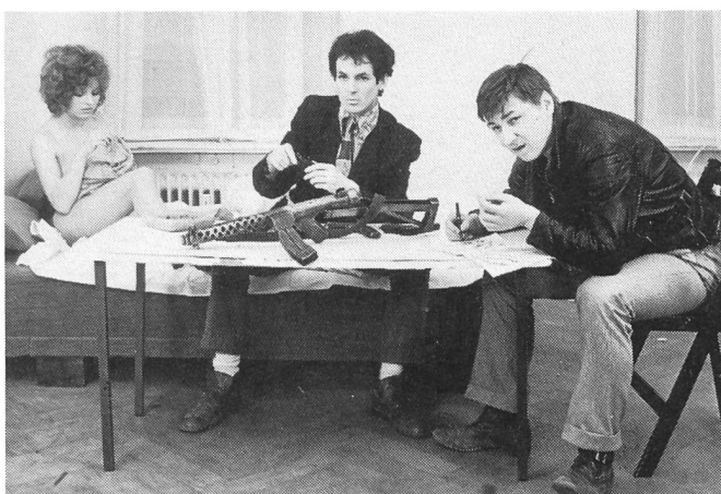
LIEBE IST KÄLTER ALS DER TOD von Rainer Werner Fassbinder