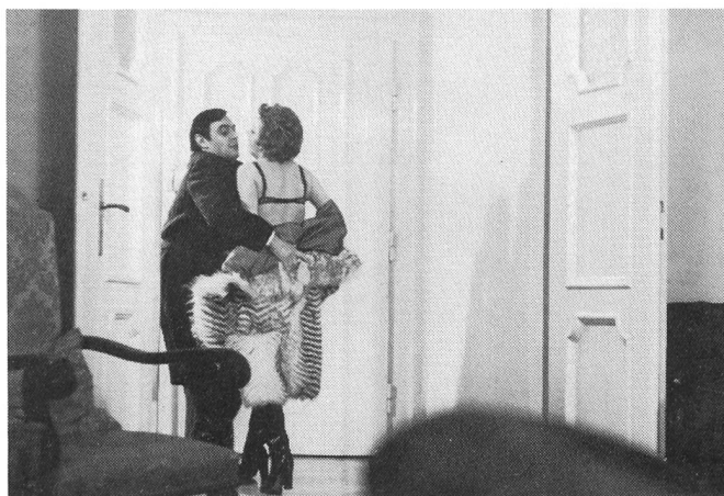
SATANSBRATEN von Rainer Werner Fassbinder