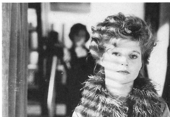
DIE BITTEREN TRÄNEN DER PETRA VON KANT von Fassbinder

noch in Deutschland. Ich rief ihn an: Pass auf, die philippinische Produktion existiert nicht, die haben keine müde Mark, ich muss das Benzin selber bezahlen, die können keine Fotokopie vom Drehbuch herstellen, nichts haben die – die wollen dich nämlich ausschmieren, wie du sie. Zwei Ausschmierer sind da zusammengekommen – und der Regisseur ist rauschgiftsüchtig, aber voll. Den kannst du auch vergessen. Jetzt kannst du dich entscheiden: alles absagen, oder aber ich verspreche dir, ich mach dir den Film, wenn du das Geld auftreibst.