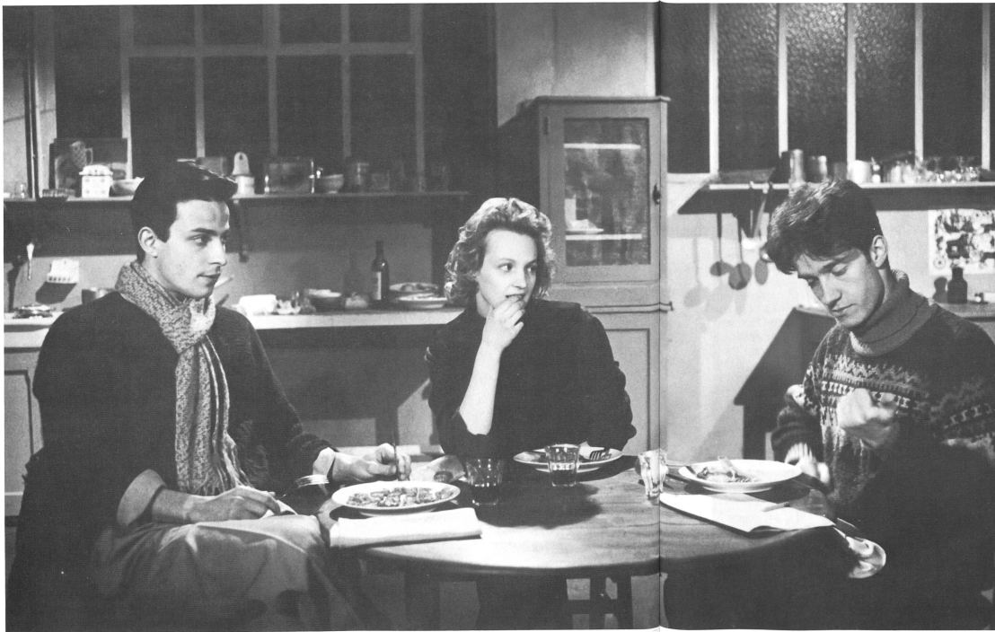
Die Teller zeigen, wer sich in wen verliebt hat und welche Figur das Feld räumen muss