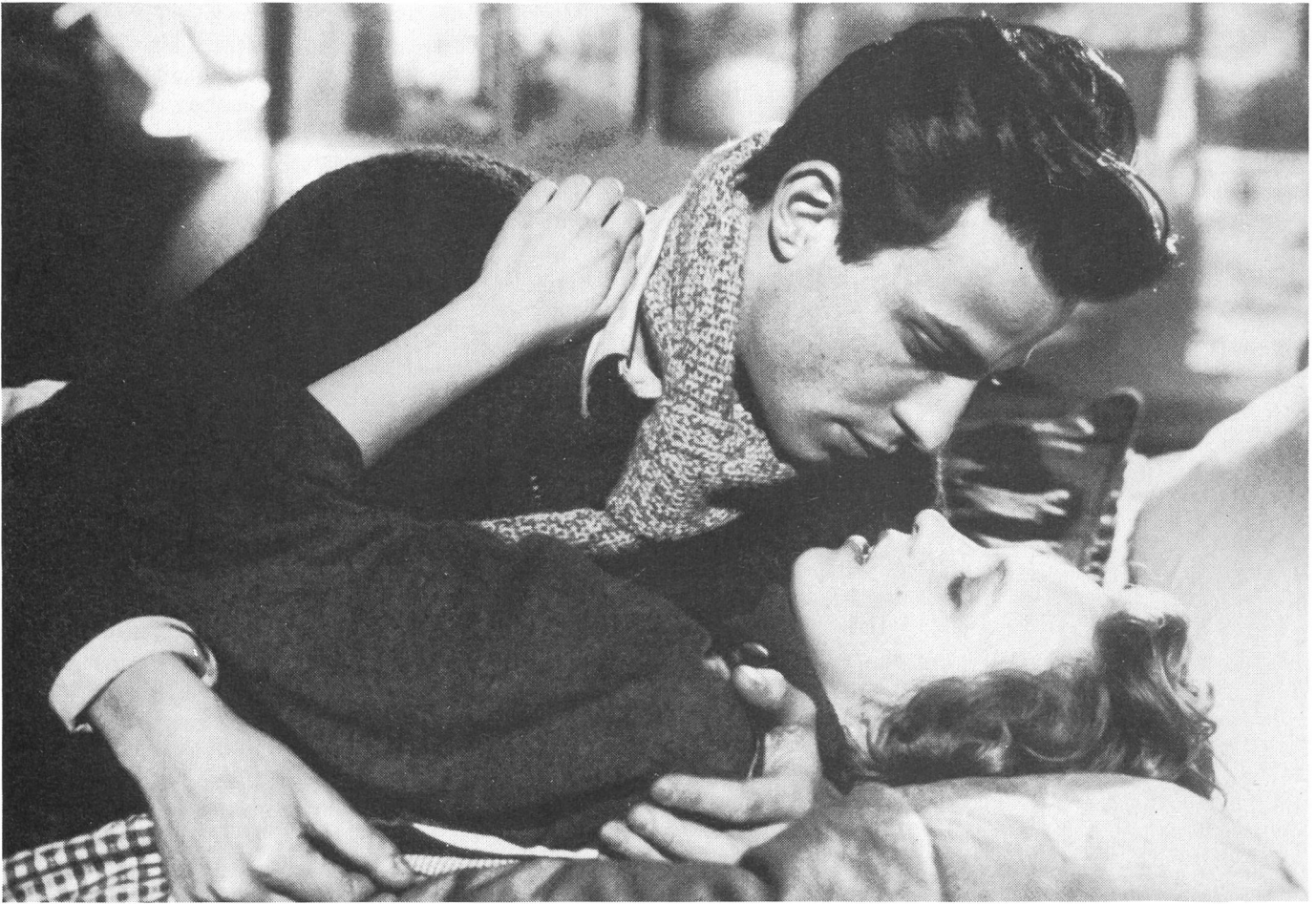
Szenen aus einem mehr oder minder ausschliesslich cinéphilen Alltag