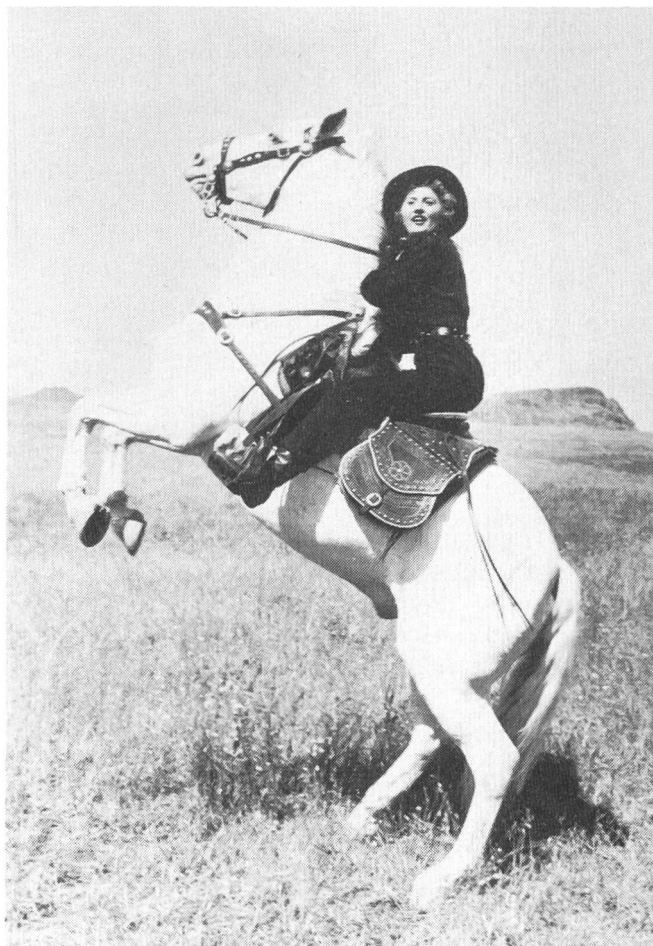
FORTY GUNS von Samuel Fuller