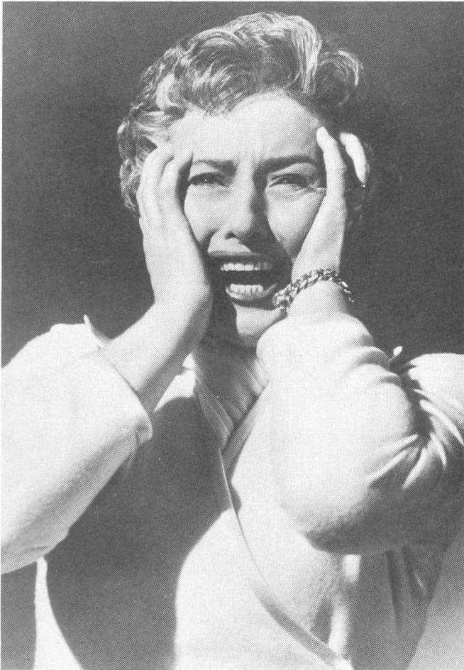
CRIME OF PASSION von Gerd Oswald