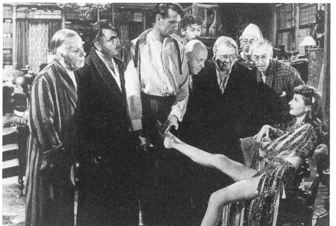
BALL OF FIRE von Howard Hawks