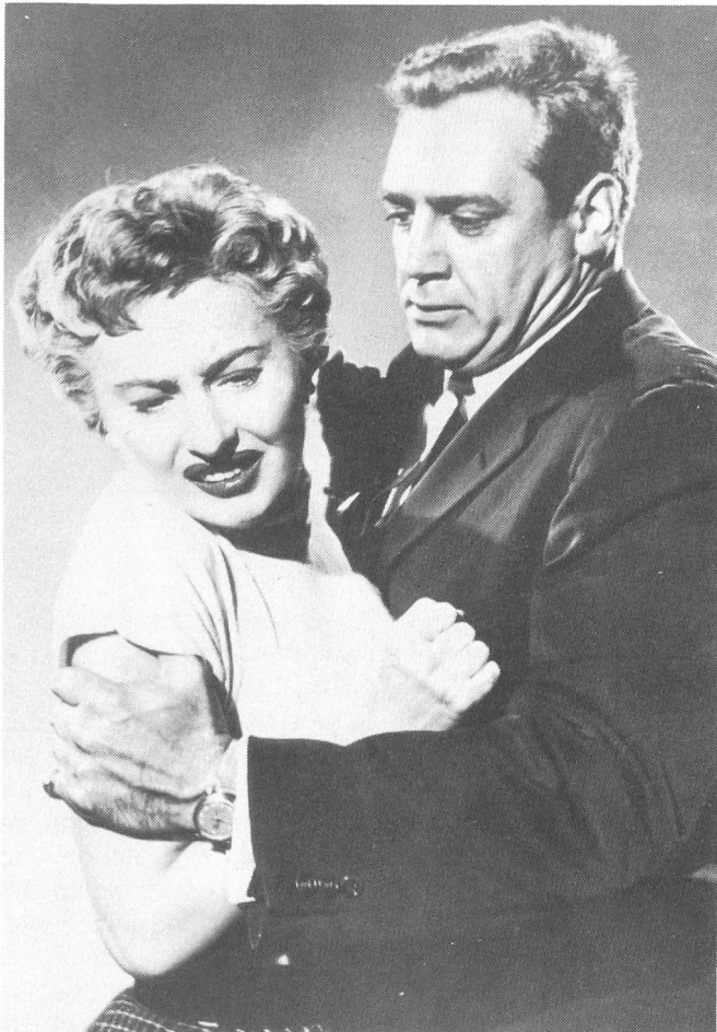
CRIME OF PASSION mit Raymond Burr

ner Rita Hayworth oder Ava Gardner hatte sie wenig im Sinn. Sie löste Phantasien über ihren Typ aus, nicht über Eskapaden.