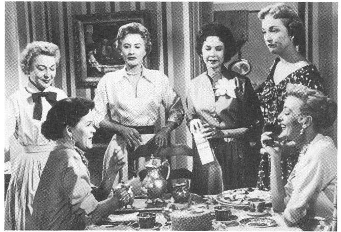
CRIME OF PASSION von Gerd Oswald

Geboren wurde Barbara Stanwyck am 16. 7. 1907 im New Yorker Stadtteil Brooklyn: als Ruby Stevens, das letzte von insgesamt fünf Kindern. Ihre Mutter starb, als Ruby gerade zwei Jahre alt war. Woraufhin ihr Vater vor Gram sein Leben änderte. Er zog es vor, die Kinder zu verlassen und zur See zu gehen.