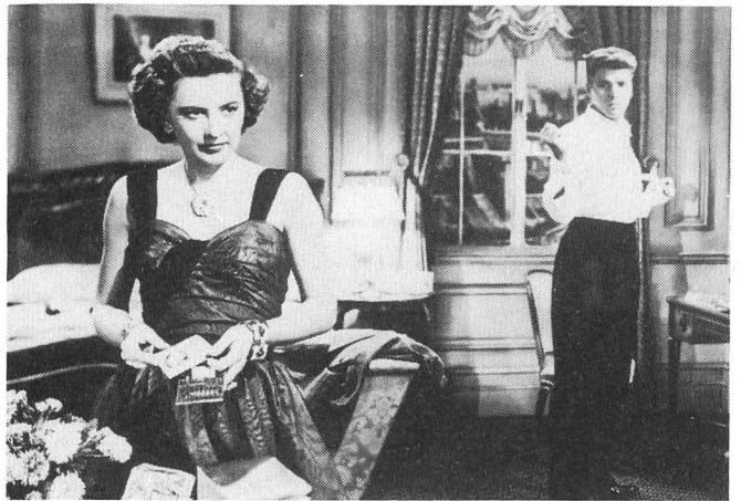
SORRY WRONG NUMBER mit Burt Lancaster