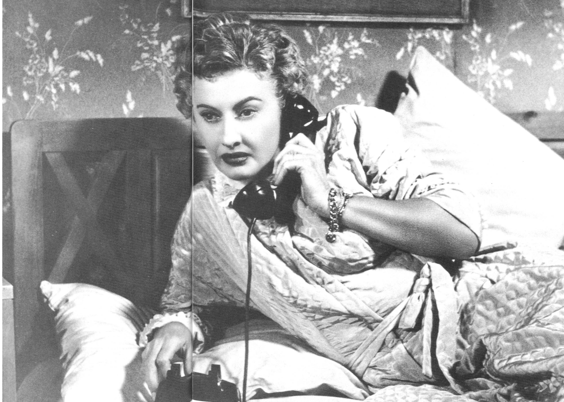
CRIME OF PASSION von Gerd Oswald

sale, vornehme Verhaltensweisen und geistreiche Dialoge. Bei Paramount ging alles immer geschmackvoll zu, sauber und luxuriös. Barbara Stanwyck sorgte hier für eine andere Klangfarbe. Sie brachte den realistischen, anti-glamourösen, zeitgemässen touch der Warner-Filme in die üblichen Glitzershows. Ihre nervöse Präsenz, ihr klares Selbstverständnis durchbrach den Zauber der schönen Illusion. Sie präsentierte statt dessen, immer und immer wieder, was eine Frau ihrer Zeit zu leisten und zu bieten vermochte.