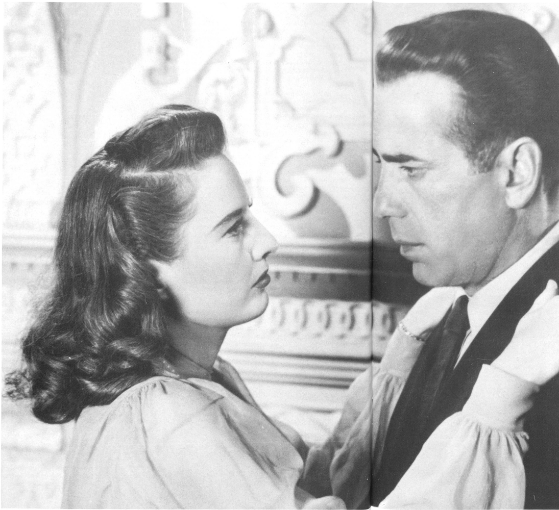
THE TWO MRS. CARROLS von Peter Godfrey

Musikantin des visuellen Scheins: Barbara Stanwyck