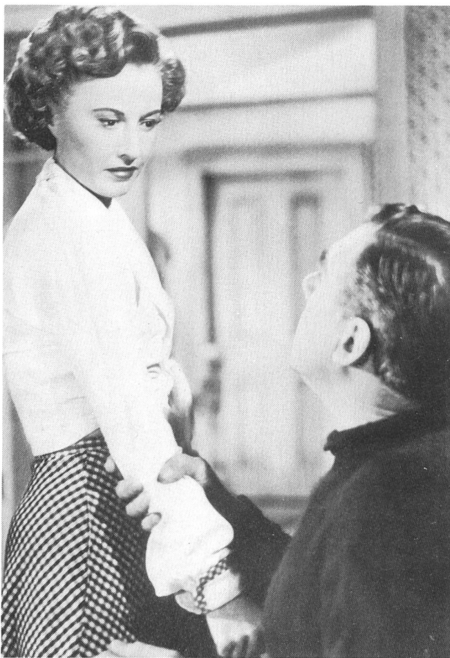
CLASH BY NIGHT von Fritz Lang

Sie ist die grosse Rancherin, the high ridin' woman with the whip , die das weite Land beherrscht, als sei es ihr Privatbesitz. Diese Herrschaft demonstriert sie, indem sie die Gewalt des Faustrechts vorführt. Indem sie im schwarzen Hosenanzug übers Land reitet, auf einem grossen weissen Pferd, mit vierzig Männern im Gefolge. Wie sie ihre Macht demonstriert, stellt sofort klar: Jeder,