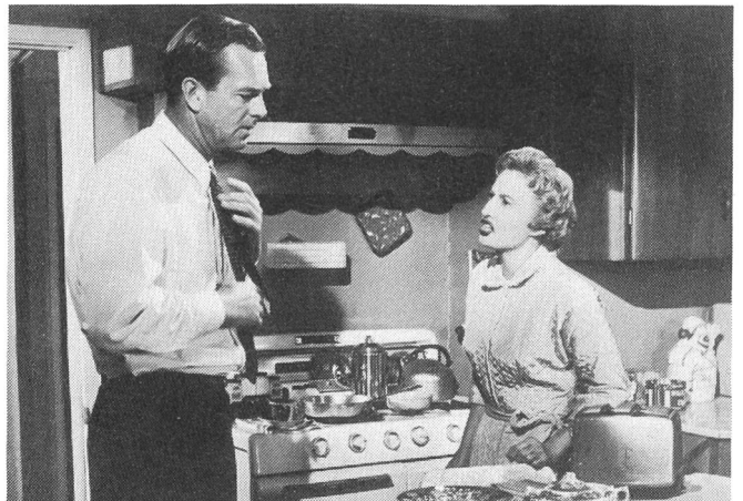
CRIME OF PASSION mit Sterling Hayden