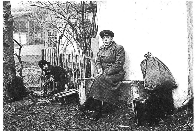
ZWANZIG TAGE OHNE KRIEG von Alexej German

zurückzukehren – im sowjetischen Film der Stalin-Ära die typische Figur des Verräters, der sich hier aber, die Stereotypen verkehrend, als der eigentliche Held erweist; zweitens ein Major der Roten Armee, dem gängigen Klischee nach ein positiver Held, der hier aber als bedenkenloser Dogmatiker dargestellt wird; drittens schliesslich der Kommandeur der Einheit, ein einfacher Mann, der seinen Instinkten und Gefühlen folgt und sich damit seine Karriere verscherzt, gespielt wird diese Figur übrigens von Rolan Bykow, dem späteren Regisseur, der heute zur Spitze des Film-Verbands gehört. Alexej German führte in seinem Film eine Auseinandersetzung mit den ästhetischen und moralischen Dogmen der Stalin-Zeit. Wie unerwünscht das 1971 war, erzählte er der Zeitschrift Nowy Mir :