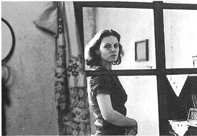
DAS EWIGE LICHT von Algimantas Puipa

Ganz verboten wurde Kira Muratowas Film LANGE ABSCHIEDE (DOLGIJE PROWODY, 1971). Erst 1987 beim nationalen Festival im georgischen Tblissi konnte der Film zum ersten Mal öffentlich gezeigt werden. Die Aufführung kam einer Rehabilitierung gleich. Bei der Abschluss-Veranstaltung in der Philharmonie von Tiflis