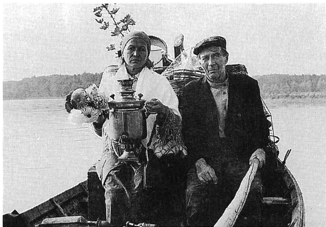
ABSCHIED VON MATJORA von Elem Klimow

wirkungen tragischer – Fall: das Verbot seines Films kam einem Berufsverbot gleich. DIE KOMMISSARIN blieb bis heute sein einziger Film. Andere Regisseure konnten weiterarbeiten, wenn auch manchmal nur unter grossen Schwierigkeiten. Aber von Eingriffen, Einschränkungen, Verboten betroffen waren viele. Elem Klimows russische Elegie ABSCHIED VON MATJORA über ein Dorf, das einem Stausee weichen muss, hatte Export-Verbot. Gleb Panfilows Film THEMA verschwand im Regal. Der estnische Regisseur Kaljo Kiisk , der ukrainische Regisseur Juri Iljenko hatten Löcher in ihrer Filmografie: verbotene Filme. Kiisk hatte 1968 in WAHNSINN (HULLUMEELSUS) eine Spionage-Geschichte aus dem Zweiten Weltkrieg in eine Nervenheilanstalt verlegt. Juri Iljenko hatte 1965 in DIE QUELLE FÜR DIE DURSTIGEN (RODNIK DLIA SCHASCH-