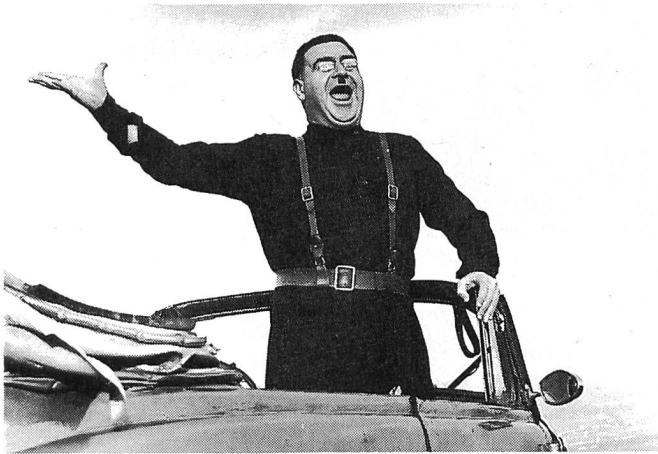
REUE von Tengis Abuladse

dumme Geschichte» erkennbar. Es wäre albern, dies zu bestreiten. Aber halten wir denn diese Tendenzen nicht mehr für sozial schädlich? Wieso müssen wir sie nun auf einmal im Film darstellen? Ist denn der Kampf gegen die reaktionären Seiten in Dostojewskijs Schaffen bereits von der Tagesordnung gestrichen? Sind denn W.I. Lenins zornige Worte von der «mehr als üblen Nachahmung des mehr als üblen Dostojewskij» bereits in Vergessenheit geraten?