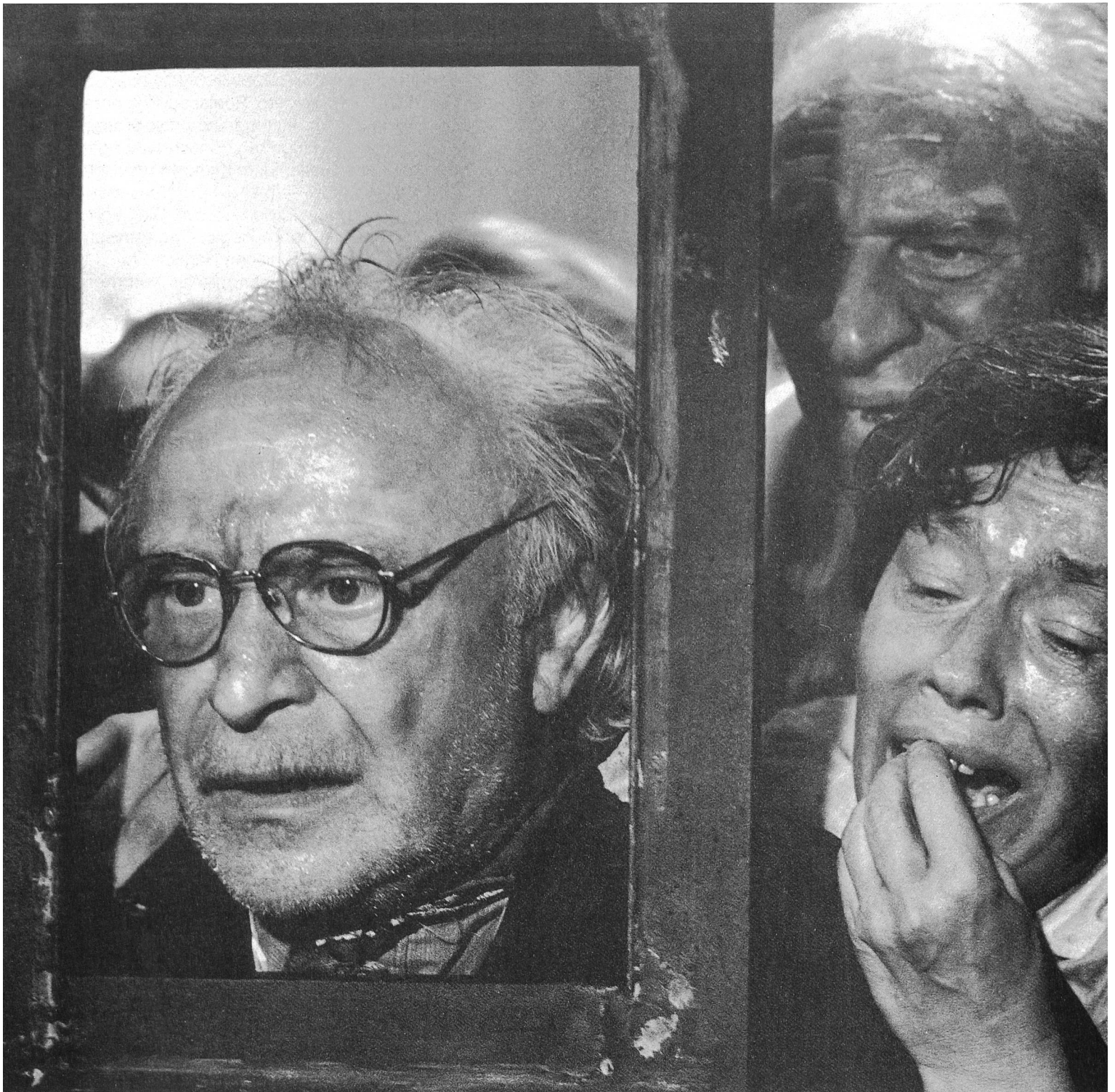
BRIEFE EINES TOTEN von Konstantin Lopuschanski

Die angesprochene Limitierung von Abonnements hat einen konkreten Anlass. Der Film-Verband beabsichtigt, eine eigene Zeitung zu publizieren. Alle nötigen Zusagen liegen vor, die Finanzierung ist gesichert. Dennoch kann die Zeitung nicht erscheinen: angeblich aus Mangel an Papier.