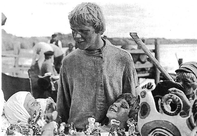
NEBYWALSCHINA von Sergej Owtsharow

Wir versuchen, die Beziehungen zwischen der staatlichen Organisation des Films GOSKINO, also dem Staatskomitee für Film, und dem «Verband der Film-