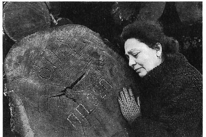
REUE von Tengis Abuladse

Institut Anfang der fünfziger Jahre geschlossen wird, weil ihre Wissenschaft, die Kybernetik, als westliche Er rungenschaft und damit als nicht-sozialistisch eingestuft wird. Ausserhalb Litauens kam der Film nur in einer zensierten, sprich: verstümmelten russischen Fassung in die Kinos. Zalakevicius' Filmografie weist nach diesem Film grössere Perioden des Schweigens auf.