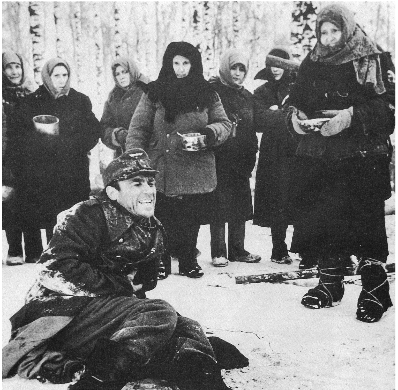
STRASSENKONTROLLE von Alexej German

TROLLE. An den Rand des Ablehnungsbescheids notierte er: