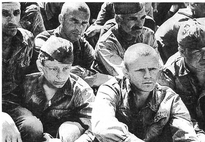
STRASSENKONTROLLE von Alexej German

Auf dem Gebiet des Films hatten die Reformen im Frühjahr 1986 begonnen. Der Verband der Filmschaffenden (Sojus kinematografistow) hatte seinen turnusmässigen Kongress. Dieser Verband hatte bis dahin kaum Einfluss auf die Produktion und den Verleih von Filmen, ebenso wenig wie auf die Auswahl von Filmen für internationale Festivals und Filmwochen. Seine Aufgaben lagen in sozialen und künstlerischen Bereichen. Man veranstaltete Diskussionen und Seminare oft zu filmhistorischen Themen im eigenen Haus des Films (Domkino) , im Zentrum Moskaus, mit dem unschätzbaren Vorzug eines eigenen, nur für Mitglieder offenen Restaurants), man unterhielt in verschiedenen Teilen des Landes Heime, in die man sich