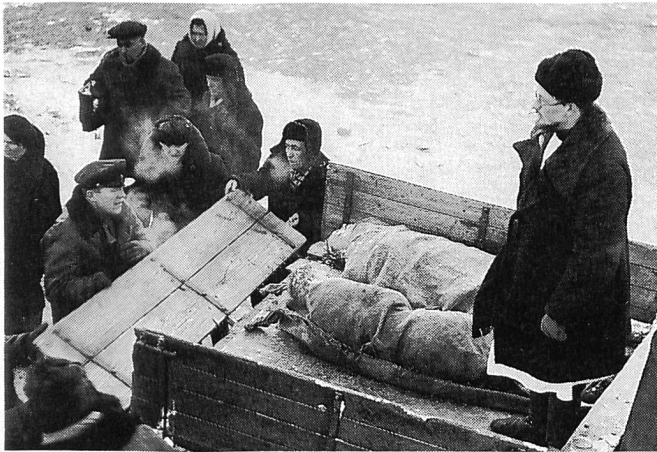
MEIN FREUND IWAN LAPSCHIN von Alexej German

STRASSENKONTROLLE, Germans erster Film, erzählt von einer Partisanen-Einheit im Zweiten Weltkrieg. Drei Figuren stehen im Mittelpunkt: ein Offizier der Roten Armee, der zu den Deutschen überläuft, um dann, nach einem erneuten Gesinnungswechsel, auf die sowjetische Seite