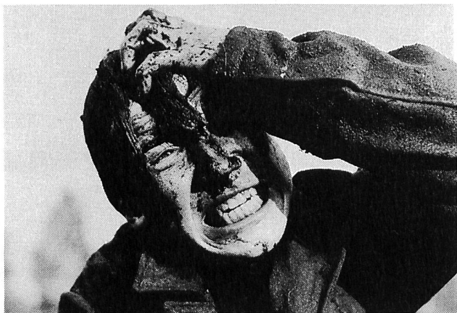
KOMM UND SIEH von Elem Klimow

Bis heute sind es knapp dreissig Spielfilme, die verboten oder nur in verstümmelten Fassungen gezeigt worden waren, und die Zahl wächst – obwohl sich die Konflikt-Kommission auf die sechziger, siebziger und achtziger Jahre konzentrierte und frühere Perioden noch überhaupt nicht in Angriff nahm. Die rehabilitierten Filme wurden in die Kinos gebracht, stehen zumindest für Festivals und Retrospektiven zur Verfügung und wurden in die Filmografien ihrer Regisseure aufgenommen, aus denen sie gestrichen worden waren – denn ein verbotener Film war nicht nur verboten, er existierte nicht. Rehabili-