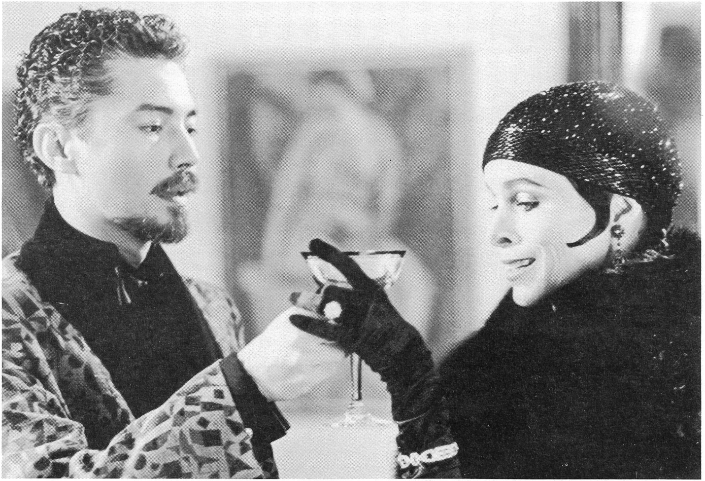
Wer da nun als berühmt oder als unberühmt zu betrachten ist, erlaubt der Film gar nicht erst zu fragen