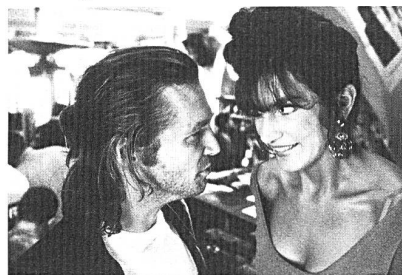
Jeff Bridges mit Mercedes Ruehl

schen “Hausmeister Gottes” (wie Parry sich selber nennt) wieder von den Toten auferstehen.