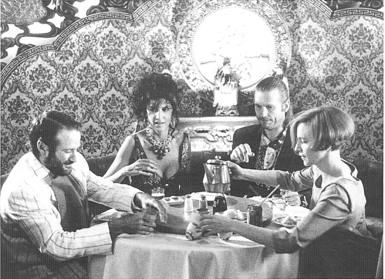
Robin Williams als Parry, Mercedes Ruehl als Anne, Jeff Bridges als Jack und Amanda Plummer als Lydia