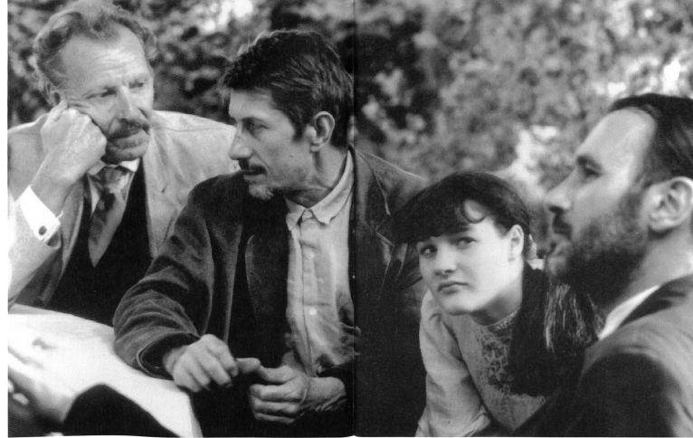
die damals neue Qualität des Lebens

Diese Charakterisierung will bewusst die Figur selber ein wenig zurückdrängen. Vor sie hin schiebt sich in lichten Bildern eine breite, lustvolle Schilderung der belle époque als einer Zeit, die es mindestens diesem Film zufolge verdient hätte, die Epoche Van Goghs genannt zu werden. Wir erhalten sinnlichen Einblick in die damals neue Qualität des Lebens, die die Kunst der Impressionisten und ihrer Nachfolger hervorgebracht hat. Wir werden der Freude am Draussensein teilhaftig, an den sommerlichen Farben, am intensiven Licht, an allem, was das Auge nicht nur Van Goghs fesselte. Wir sind bei den Tänzen und Unterhaltungen dabei und hören die Musik. Und wir glauben, das alles zu riechen.