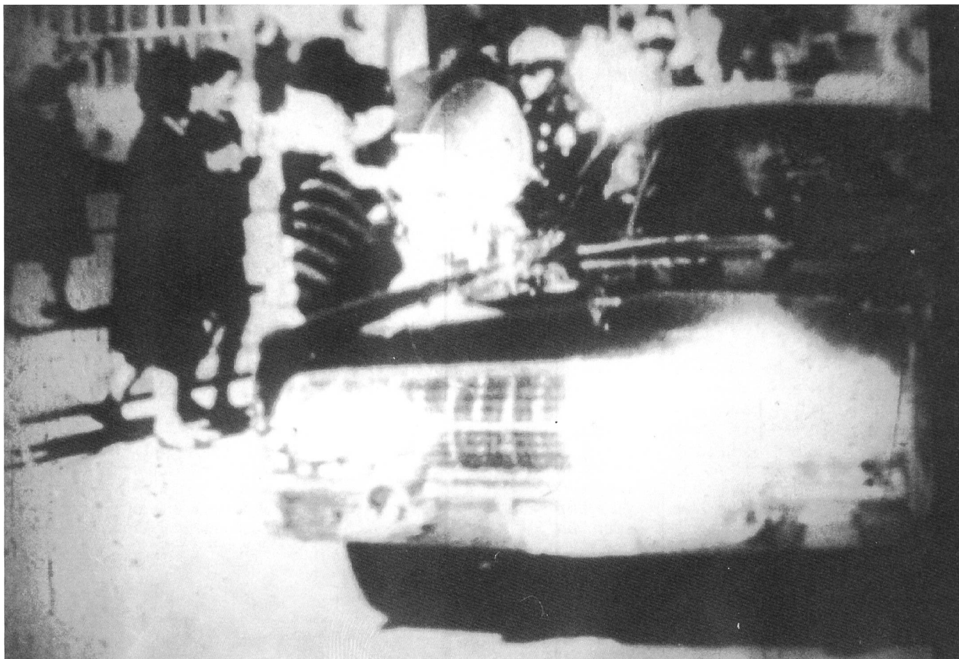
REPORT von Bruce Conner (1963 – 67)

Eine andere Verbindung, welche eine kollektive Erfahrung ins Subjektive überführt, ist ein Bild, das wie ein Leitmotiv den ganzen Film durchzieht: die stark verlangsamte Nahaufnahme des Gesichts einer Japanerin an einem Wasserstrahl, die Umsetzung eines Phantasiebildes, das immer wieder in der Erinnerung auftaucht (wie die Ich-Stimme der Autorin am Schluss des Filmes erklärt). Dieses stückweise und ungeschlossene Aufbauen einer subjektiven Erinnerung und individuellen Geschichte in diesem Film hindert uns als ZuschauerInnen jedoch nicht an der eigenen Erinnerungsarbeit.