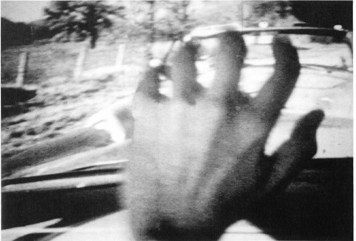
ZÉRO GRAVITÉ von Jean-Claude Bustros (1991)

das sei das Ziel des Films). In diese "Figuren" werden Erinnerungen eingearbeitet.