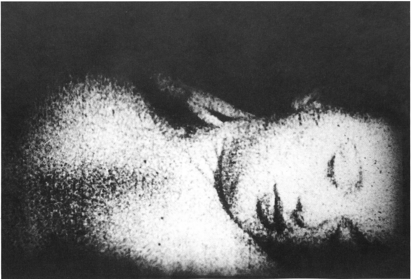
MARILYN TIMES FIVE von Bruce Conner (1968 – 73)