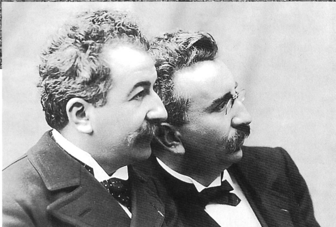
Auguste et Louis Lumière Inventeurs du Cinématographe