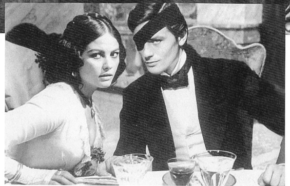
Luchino Visconti 2. November 1906 – 17. März 1976