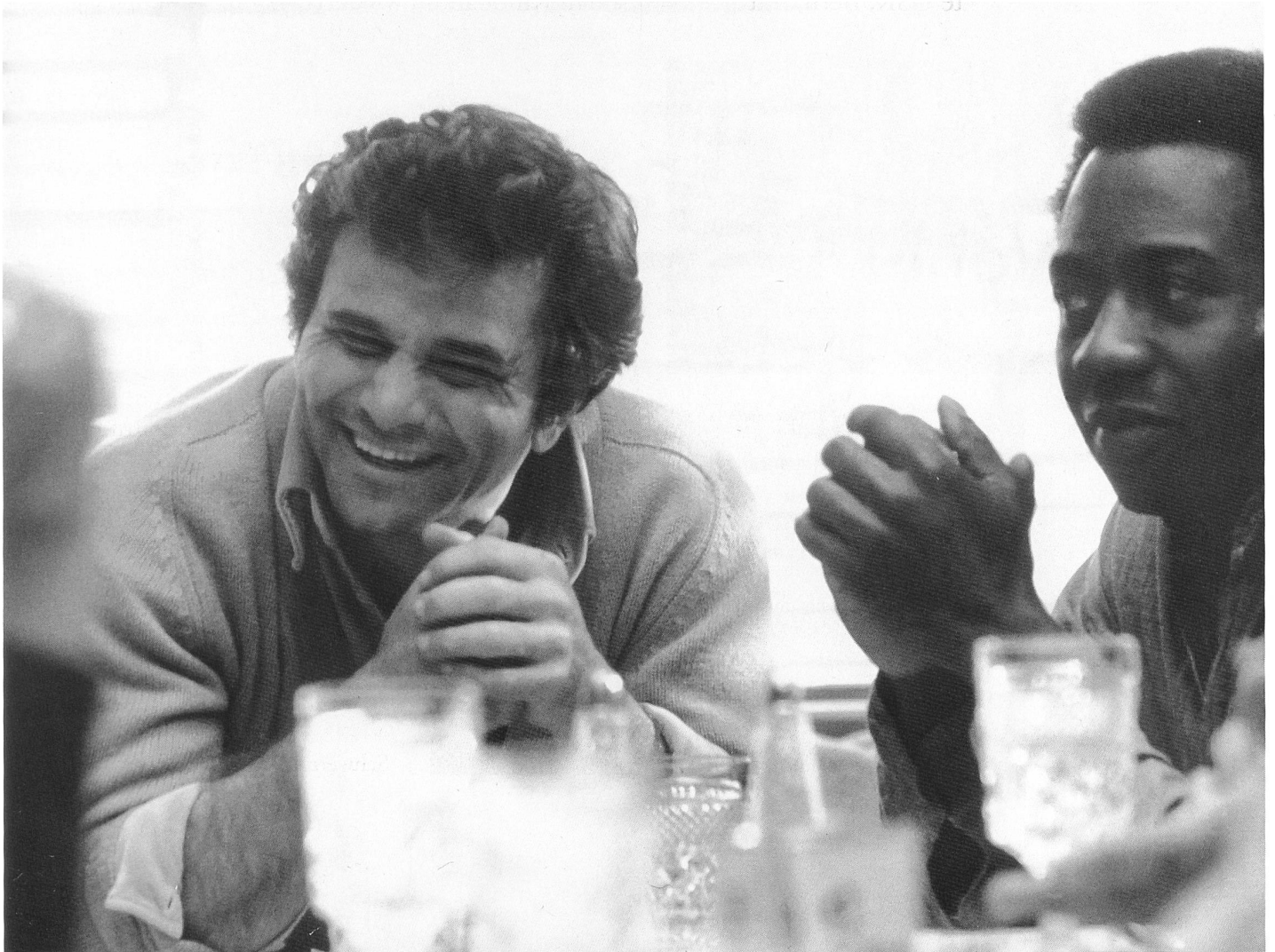
Peter Falk in A WOMAN UNDER THE INFLUENCE Regie: John Cassavetes

«Cassavetes' Gesamtwerk ist aber auch so etwas wie die Geschichte einer Ehe, persönlich und modellhaft auch, eine Liebesgeschichte, eine Freundschaft, eine künstlerische Partnerschaft, in der sich all das ereignen muss, was geschieht, weil nicht nur die Liebe, sondern auch die Macht durch die Menschen fließt.»