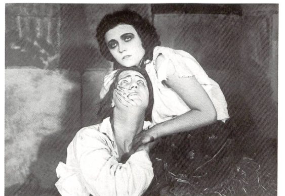
3 MADAME DUBARRY Regie: Ernst Lubitsch (1919)