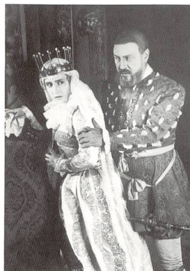
2 ANNA BOLEYN Regie: Ernst Lubitsch (1920)