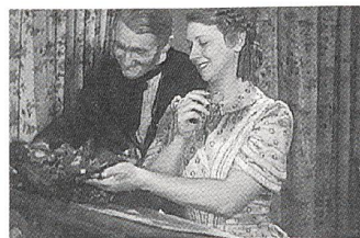
MADAME BOVARY Regie: Jean Renoir (1934)