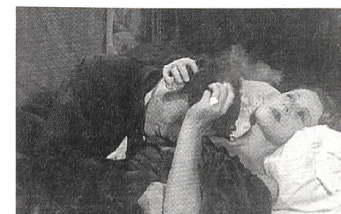
MADAME BOVARY Regie: Jean Renoir (1934)