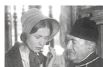
MADAME BOVARY Regie: Claude Chabrol (1991)