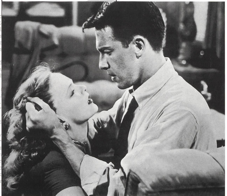
GUN CRAZY Blacklisted: Dalton Trumbo (Co-Autor), Regie: Joseph H. Lewis, mit Peggy Cummins und John Dall, 1949

The producer of this picture is Adrian Scott and the Director Edward of whom are identified in Section I of this memorandum as Communists.