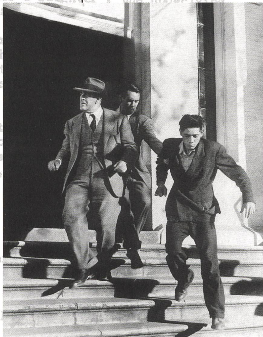
THE LAWLESS Blacklisted: Joseph Losey (Regie), 1950

entitled "From the Hollywood Sets" by [redacted] magazine issue of August, 1947, [redacted] "Armer's Daughter". the underlined