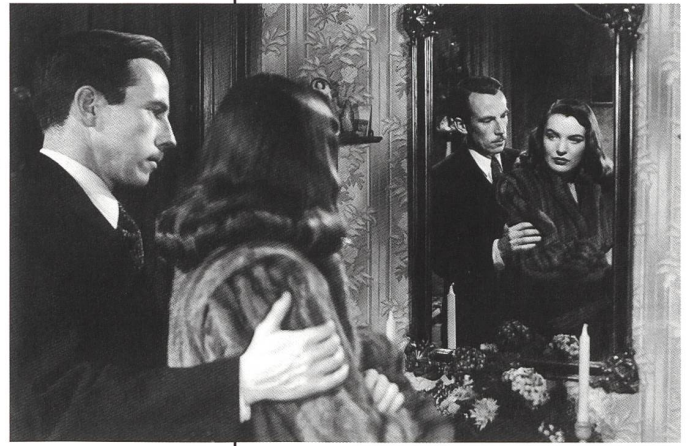
BRUTE FORCE Blacklisted: Jules Dassin (Regie), mit Whit Bissell und Ella Raines, 1947

The producer of this picture is Adrian Scott and the Director Edward of whom are identified in Section I of this memorandum as Communists.