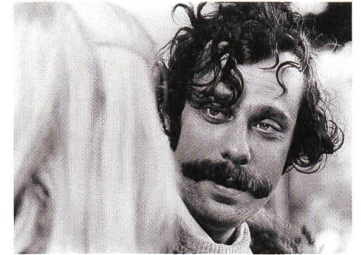
Jean-Luc Bideau in LES ARPEUTEURS Regie: Michel Soutter

Die 39. Ausgabe der Solothurner Filmtage vom 19. bis 25. Januar 2004 wird mit der Uraufführung von KROKUS – AS LONG AS WE LIVE, einem Dokumentarfilm über die Schweizer Rockband von Reto Caduff, eröffnet.