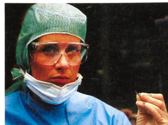
SPITAL IN ANGST

FOCAL, die Stiftung für die Weiterbildung der Filmbranche in der Schweiz, zählt zu den bedeutendsten Institutionen in Europa, die Drehbuchautoren und Drehbuchautorinnen weiterbilden. Die inzwischen geläufigen, projektbezogenen und meist in gemeinsamer Trägerschaft mit europäischen Partnern durchgeführten Programme zur Drehbuchentwicklung sind in der Regel mehrteilig aufgebaut, werden über Jahre hinweg in regelmässigen Abständen angeboten und immer wieder den Entwicklungen angepasst. Seit 1997 bietet FOCAL mit «Nous les Suisses» für die Suisse Romande und mit «Fernsehfilme SF DRS» für die deutschsprachige Schweiz (seit 1999) auch Stoffentwicklung in Zusammenarbeit mit den nationalen Fernsehsendern an.