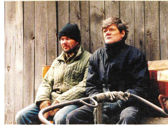
EDI Regie: Piotr Trzaskalski