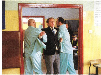
POGODA NA JUTRA Regie: Jerzy Stuhr