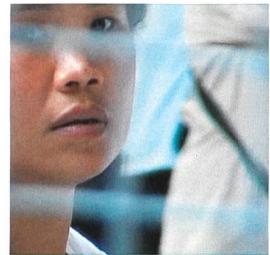
MALEE AND THE BOY Regie: Apichatpong Weerasethakul

Bereits zum elften Mal findet in Nyon (18. – 24. April 2005) das internationale Festival Visions du réel statt. Als grösstes Filmfestival der Westschweiz bietet es Publikum und Filmschaffenden einen gut besuchten Treffpunkt abseits des Mainstreamkinos. Der Direktor Jean Perret versteht diesen Anlass als Plattform für ein «Kino der Wirklichkeit», ein «Filmschaffen, das die starren Grenzen des Dokumentarfilms hinter sich gelassen hat und neue Formen ausprobiert (vom experimentellen Essay über die epische Erzählung bis zum Ich-Film und den grossen Reportagen) – diese Filme, die sich um die Wirklichkeit drehen, stehen mit beiden Füßen auf dem Boden und setzen sich mit deren Facetten, Komplexitäten und Widersprüchen auseinander» (Perret in «Cinema» 50).