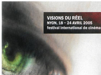
VISIONS DU RÉEL NYON, 18 - 24 AVRIL 2005 festival international de cinéma