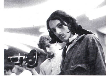
LYDIA Regie: Reto A. Savoldelli

also etwas sein, das sich auf der Strasse bewegt. Die Grösse stimmt auch.