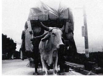
HEREMIAS Regie: Lav Diaz