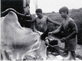
HEREMIAS Regie: Lav Diaz