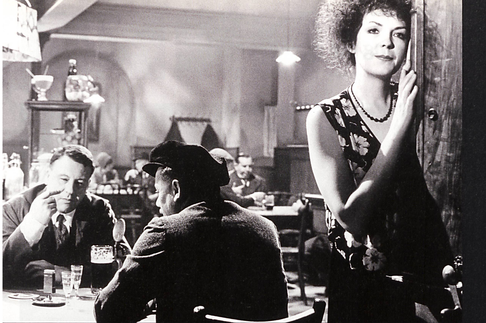
1 Annemarie Düringer als Cilly; 2 Günter Lamprecht als Franz Biberkopf, Franz Buchrieser als Meck und Elisabeth Trissenaar als Lina; 3 Gottfried John als Reinhold mit Barbara Sukowa als Mieke; 4 in der Irrenanstalt; 5 Hanna Schygulla als Eva

eine neue Plastizität bekommen. Allerdings legt sich die vorgenommene Aufhellung wie ein digitaler Firnis über die Bilder. Das Nachträgliche der aufhellenden Bearbeitung ist ihnen eingeschrieben. BERLIN ALEXANDERPLATZ wirkt nun wie das postmoderne Remastering eines alten Beatles-Songs, bei dem man die ursprüngliche Produktionsästhetik, das Grundrauschen der primitiven Vierkanal-Tontechnik und des Plattenspielers vermisst. Jüngst haben 25 ehemalige Fassbinder-Mitarbeiter gegen diesen nachträglichen Eingriff durch die Fassbinder-Foundation protestiert. Sie sehen darin den Versuch, den Film leichter konsumierbar zu machen, etwas, was der Regisseur mit seiner kunstvoll durchkonstruierten Werkästhetik genau verhindern wollte. Unter dem Deckmantel der technischen Restaurierung würde der vielleicht wichtigste Werkkomplex Rainer Werner Fassbinders ästhetisch «verfälscht».