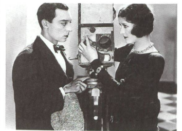
Buster Keaton in THE CAMERAMAN Regie: Buster Keaton