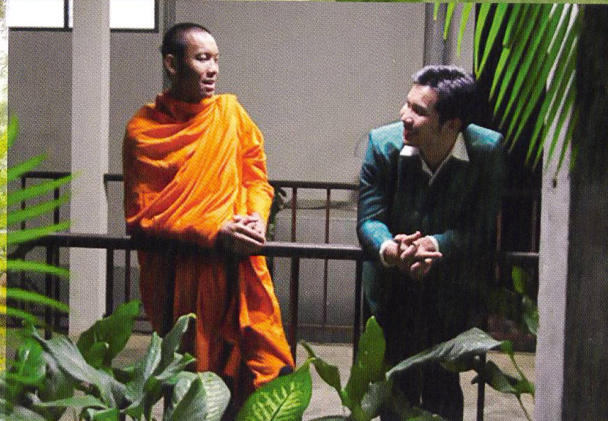
TROPICAL MALADY SYNDROMES AND A CENTURY THE ADVENTURES OF IRON PUSSY