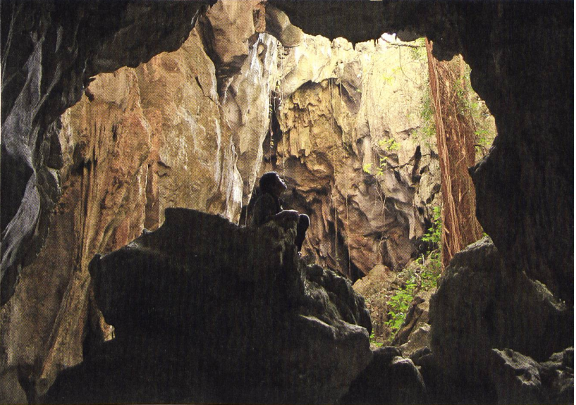
UNCLE BOONMEE WHO CAN RECALL HIS PAST LIVES