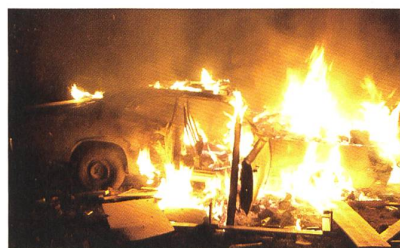
ESTE ES MI REINO