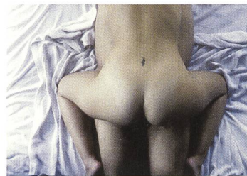
BATALLA EN EL CIELO