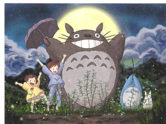
MEIN NACHBAR TOTORO (TONARI NO TOTORO) Regie: Hayao Miyazaki