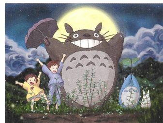
MEIN NACHBAR TOTORO (TONARI NO TOTORO) Regie: Hayao Miyazaki