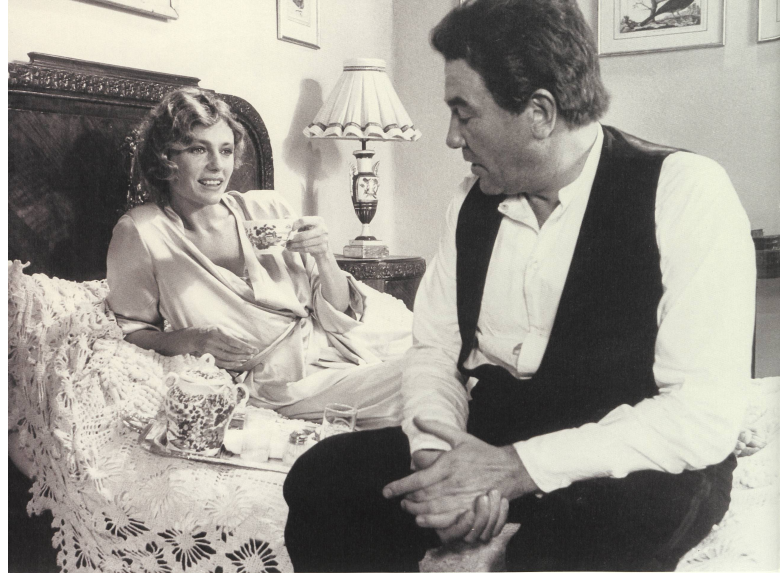
1 Jacqueline Bisset und Albert Finney in 'UNDER THE VOLCANO'. Regie: John Huston (1964). 2 Jean-Paul Belmondo und Jacqueline Bisset in 'LE BACHINISTE'. Regie: Philippe de Broca (1973). 3 Jacqueline Bisset und Steve McQueen in 'HARVEY MILK'. Regie: Gus Van Sant (1999). 4 Catherine Deneuve und Jean-Paul Belmondo in 'LA MAMMIFÈRE' (1973). 5 LE MAMMIFÈRE