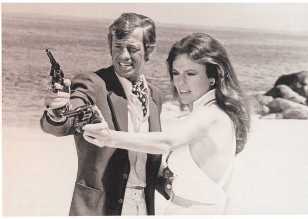
11 Jean-Paul Belmondo und Jacqueline Bisset in LES MAGNIFIQUES . Regie: Philippe de Broca (1975). 12 13 14 15 16 17 18 19 20 21 22 23 24 25 26 27 28 29 30 31 32 33 34 35 36 37 38 39 40 41 42 43 44 45 46 47 48 49 50 51 52 53 54 55 56 57 58 59 60 61 62 63 64 65 66 67 68 69 70 71 72 73 74 75 76 77 78 79 80 81 82 83 84 85 86 87 88 89 90 91 92 93 94 95 96 97 98 99 100 101 102 103 104 105 106 107 108 109 110 111 112 113 114 115 116 117 118 119 120 121 122 123 124 125 126 127 128 129 130 131 132 133 134 135 136 137 138 139 140 141 142 143 144 145 146 147 148 149 150 151 152 153 154 155 156 157 158 159 160 161 162 163 164 165 166 167 168 169 170 171 172 173 174 175 176 177 178 179 180 181 182 183 184 185 186 187 188 189 190 191 192 193 194 195 196 197 198 199 200 201 202 203 204 205 206 207 208 209 210 211 212 213 214 215 216 217 218 219 220 221 222 223 224 225 226 227 228 229 230 231 232 233 234 235 236 237 238 239 240 241 242 243 244 245 246 247 248 249 250 251 252 253 254 255 256 257 258 259 260 261 262 263 264 265 266 267 268 269 270 271 272 273 274 275 276 277 278 279 280 281 282 283 284 285 286 287 288 289 290 291 292 293 294 295 296 297 298 299 300 301 302 303 304 305 306 307 308 309 310 311 312 313 314 315 316 317 318 319 320 321 322 323 324 325 326 327 328 329 330 331 332 333 334 335 336 337 338 339 340 341 342 343 344 345 346 347 348 349 350 351 352 353 354 355 356 357 358 359 360 361 362 363 364 365 366 367 368 369 370 371 372 373 374 375 376 377 378 379 380 381 382 383 384 385 386 387 388 389 390 391 392 393 394 395 396 397 398 399 400 401 402 403 404 405 406 407 408 409 410 411 412 413 414 415 416 417 418 419 420 421 422 423 424 425 426 427 428 429 430 431 432 433 434 435 436 437 438 439 440 441 442 443 444 445 446 447 448 449 450 451 452 453 454 455 456 457 458 459 460 461 462 463 464 465 466 467 468 469 470 471 472 473 474 475 476 477 478 479 480 481 482 483 484 485 486 487 488 489 490 491 492 493 494 495 496 497 498 499 500 501 502 503 504 505 506 507 508 509 510 511 512 513 514 515 516 517 518 519 520 521 522 523 524 525 526 527 528 529 530 531 532 533 534 535 536 537 538 539 540 541 542 543 544 545 546 547 548 549 550 551 552 553 554 555 556 557 558 559 560 561 562 563 564 565 566 567 568 569 570 571 572 573 574 575 576 577 578 579 580 581 582 583 584 585 586 587 588 589 590 591 592 593 594 595 596 597 598 599 600 601 602 603 604 605 606 607 608 609 610 611 612 613 614 615 616 617 618 619 620 621 622 623 624 625 626 627 628 629 630 631 632 633 634 635 636 637 638 639 640 641 642 643 644 645 646 647 648 649 650 651 652 653 654 655 656 657 658 659 660 661 662 663 664 665 666 667 668 669 670 671 672 673 674 675 676 677 678 679 680 681 682 683 684 685 686 687 688 689 690 691 692 693 694 695 696 697 698 699 700 701 702 703 704 705 706 707 708 709 710 711 712 713 714 715 716 717 718 719 720 721 722 723 724 725 726 727 728 729 730 731 732 733 734 735 736 737 738 739 740 741 742 743 744 745 746 747 748 749 750 751 752 753 754 755 756 757 758 759 760 761 762 763 764 765 766 767 768 769 770 771 772 773 774 775 776 777 778 779 780 781 782 783 784 785 786 787 788 789 790 791 792 793 794 795 796 797 798 799 800 801 802 803 804 805 806 807 808 809 810 811 812 813 814 815 816 817 818 819 820 821 822 823 824 825 826 827 828 829 830 831 832 833 834 835 836 837 838 839 840 841 842 843 844 845 846 847 848 849 850 851 852 853 854 855 856 857 858 859 860 861 862 863 864 865 866 867 868 869 870 871 872 873 874 875 876 877 878 879 880 881 882 883 884 885 886 887 888 889 890 891 892 893 894 895 896 897 898 899 900 901 902 903 904 905 906 907 908 909 910 911 912 913 914 915 916 917 918 919 920 921 922 923 924 925 926 927 928 929 930 931 932 933 934 935 936 937 938 939 940 941 942 943 944 945 946 947 948 949 950 951 952 953 954 955 956 957 958 959 960 961 962 963 964 965 966 967 968 969 970 971 972 973 974 975 976 977 978 979 980 981 982 983 984 985 986 987 988 989 990 991 992 993 994 995 996 997 998 999 1000