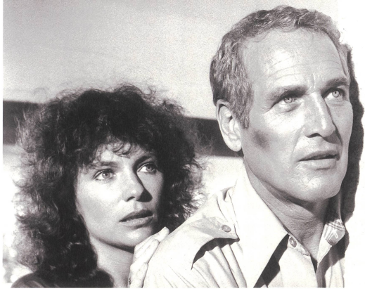
1. Jacqueline Bisset und Paul Newman in WHEN TIME WAS OUT... , Regie: James Goldstone (1960); 2. Jacqueline Bisset und Joan Van Fleet in DER RICHTERBLIND SEIN DENKEN , Regie: Mauro Bolognini (1961); 3. Jacqueline Bisset und Jean-Paul Belmondo in LA FEMME NIKITA , Regie: Luc Besson (1990); 4. Peter Sarsgaard, Stellan Skarsgård, Regie: Peter Collinson (1995); 5. Jacqueline Bisset und James Louis Ferrigno in LA DONNA DELLA DORNBURGIA , Regie: Luigi Comencini (1975)