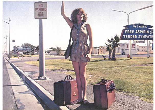
3. Jacqueline Bisset und Jean Rochefort in BUCH UND FAHND. Regie: George Cukor (1968). 2. THE GRASS IS GREENER. Regie: George Cukor (1960). 1. THE GRASS IS GREENER. Regie: George Cukor (1960). 4. THE GRASS IS GREENER. Regie: George Cukor (1960). 5. Jacqueline Bisset am Festival del Film Locarno 2013. Regie: François Truffaut (1973).

JACQUELINE BISSET Also, bei dem Film hab ich nichts kapiert! Zumindest hab ich nicht viel begriffen. Ich fand das ehrlich zu kompliziert. Ich hab die ganze Geschichte nicht verstanden, diese Kriminalgeschichte. Meine Beziehung zu Jean-Louis Trintignant hab ich verstanden, ich fand es klasse, dass wir beste Freunde sind, und ich war froh, wieder mit Marcello Mastroianni zusammenzuarbeiten, aber ganz ehrlich: Das Ganze, das hab ich nicht kapiert. Es gibt noch einen anderen Film, den ich nie verstanden habe: BULLITT. Ich hab ihn mir x-mal angesehen, aber wenn Sie den Anfang verpassen beziehungsweise das, was noch während des Vorspanns passiert, dann verstehen Sie nicht mehr, als was ich verstanden habe, da bin ich mir ganz sicher! (lacht herzlich)