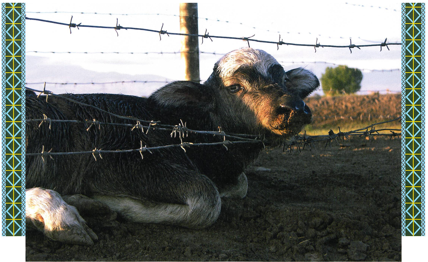
BORDER / SAHMAN (2009)