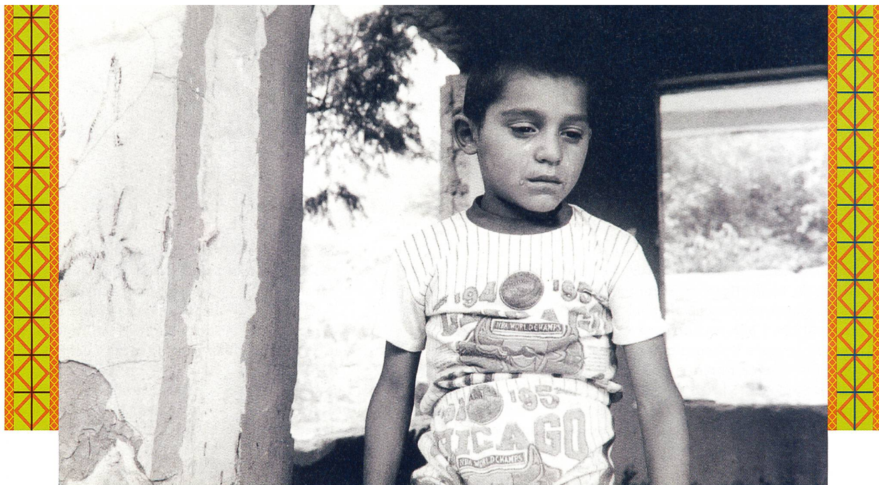
DOKUMENTARIST / VAVERAGROGH (2003)