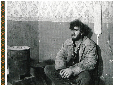
RÜCKKEHR INS GELOBTE LAND / VERADARZ AVETYATS YERKIR (1991)