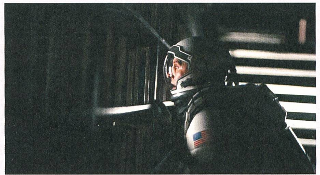
Blick in die Vergangenheit

Ein Gespenst geht um in der Cineasten-Welt – das Gespenst des Spoilers. Mein Einstieg mag ein wenig dramatisch klingen, tatsächlich aber hat sich in den vergangenen Jahren eine regelrechte Spoilerphobie in der Filmwelt breitgemacht. Wer es heute noch wagt, etwas über den Inhalt eines aktuellen Films oder einer Fernsehserie zu erzählen, dem ist gesellschaftliche Ächtung gewiss.