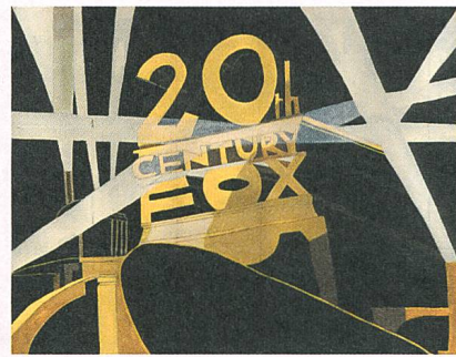
20th Century Fox (2012)