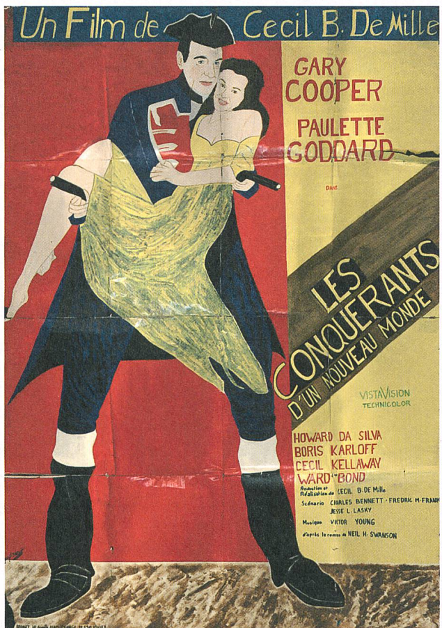
Les conquérants d'un nouveau monde (2012)