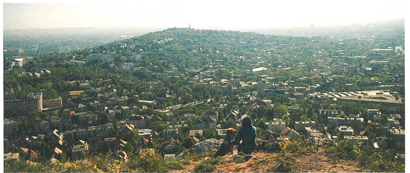
White God Ein unzertrennliches Paar: Lili und Hagen S. 25