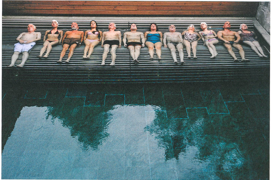
Youth Wellness im Alpenresort