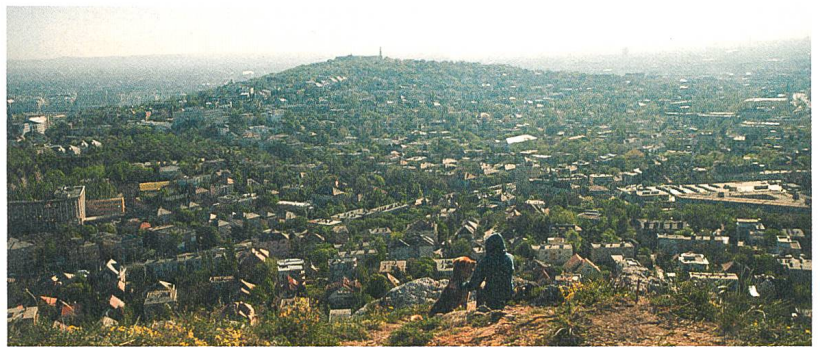
White God Ein unzertrennliches Paar: Lili und Hagen S. 25