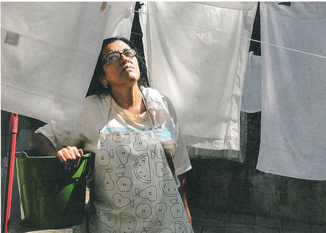
Que horas ela volta? Regina Casé ist in Brasilien ein Star