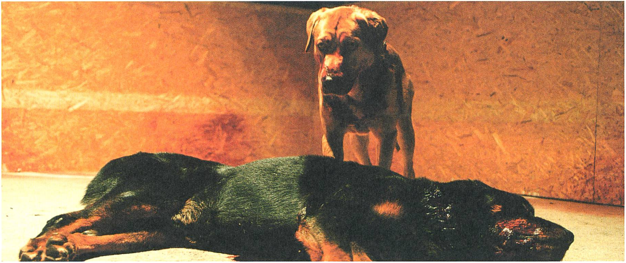
White God Der Mensch im Tier S. 25