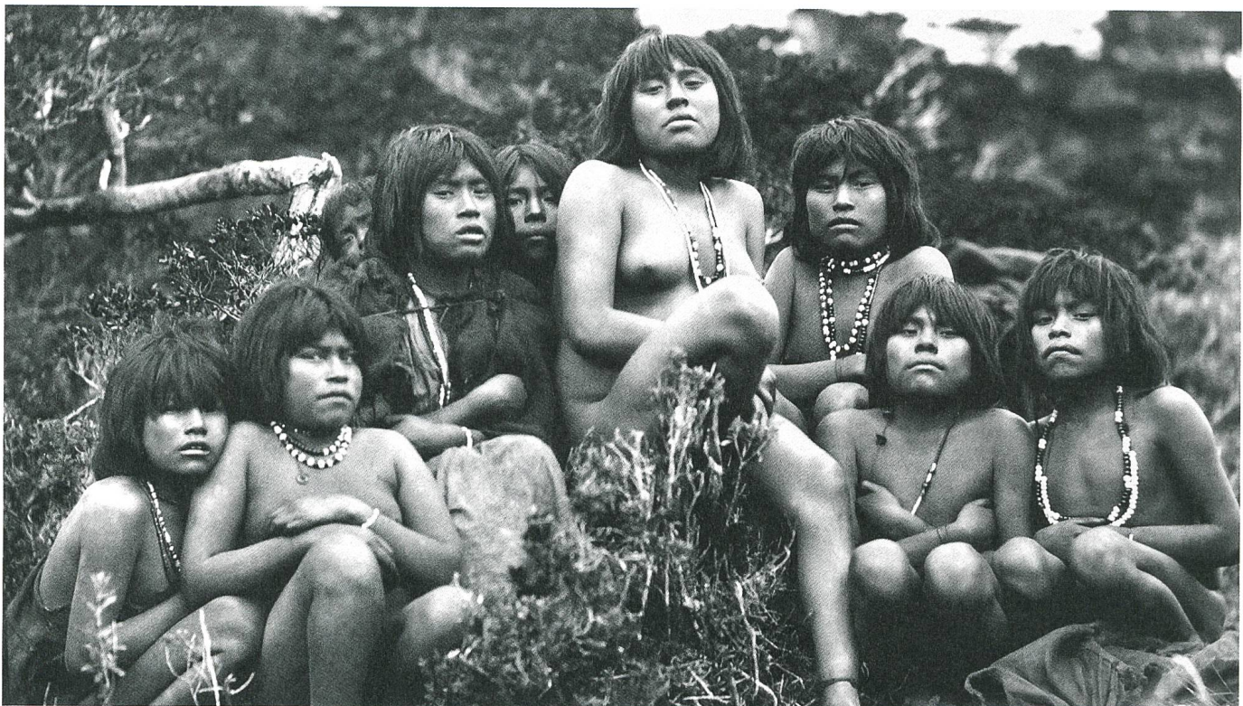
El botón de nácar Überlebende der chilenischen Urbevölkerung: Selknam-Indianer S. 32