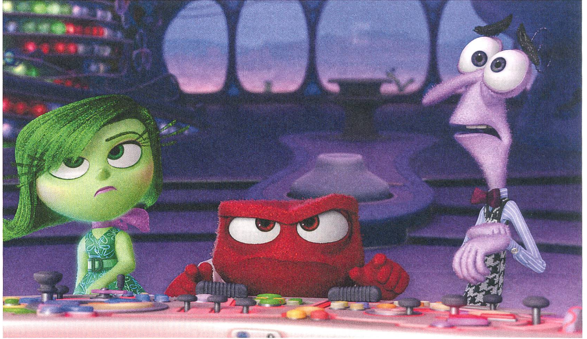
Inside Out Gefühle in der Schaltzentrale