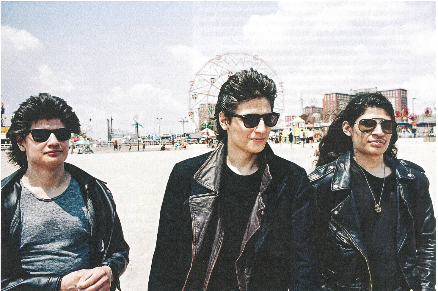
The Wolfpack Hart erkämpfte Freiheit