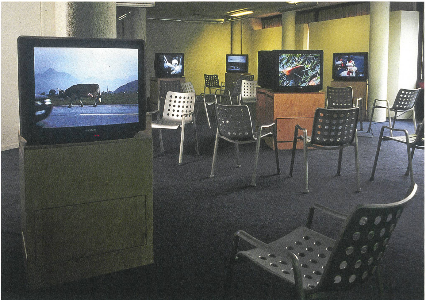
Peter Fischli / David Weiss: Arbeiten im Dunkel, 1995 12 Videos à 8h, Installationsansicht Centre pour l'image contemporaine, Saint-Gervais, Genf, 1997