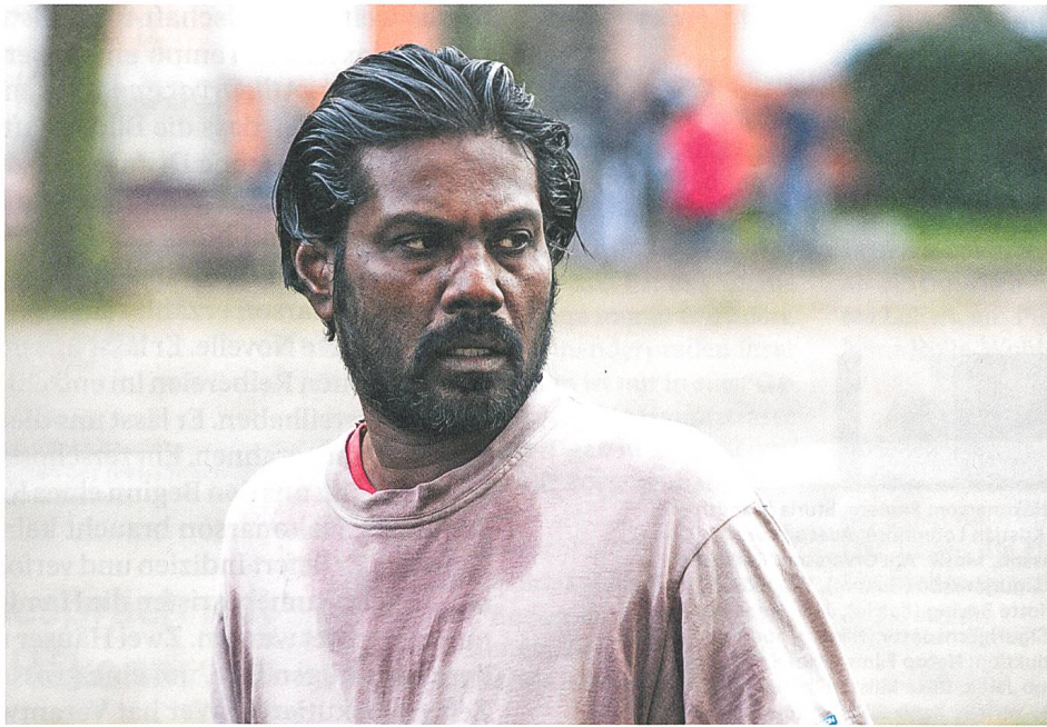
Dheepan Anthonythasan Jesuthasan