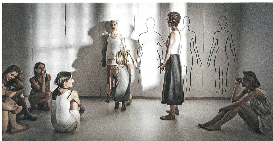
Body Sich selbst begegnen