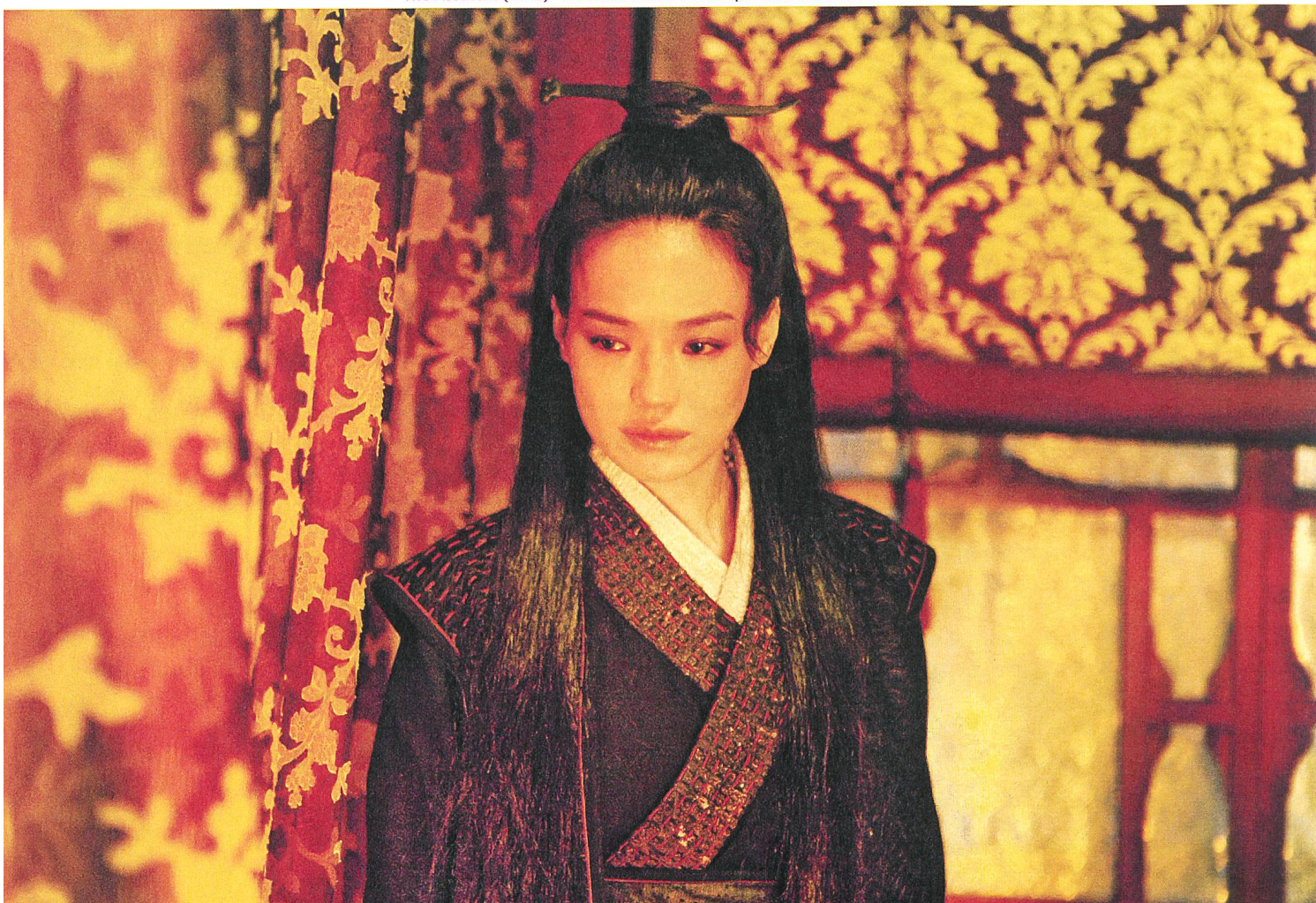
The Assassin (2015) Atemberaubende Kampf- und Filmkunst