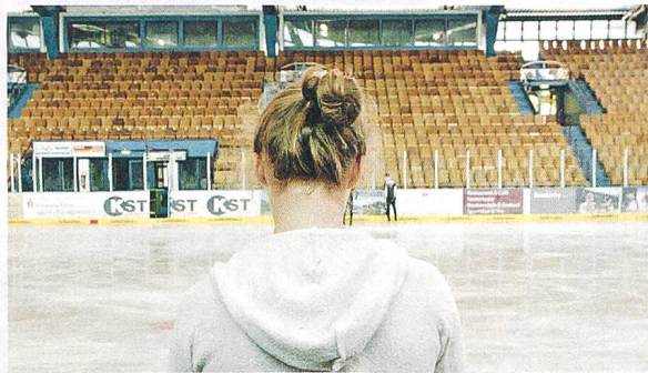
Eismädchen Regie: Lin Sternal