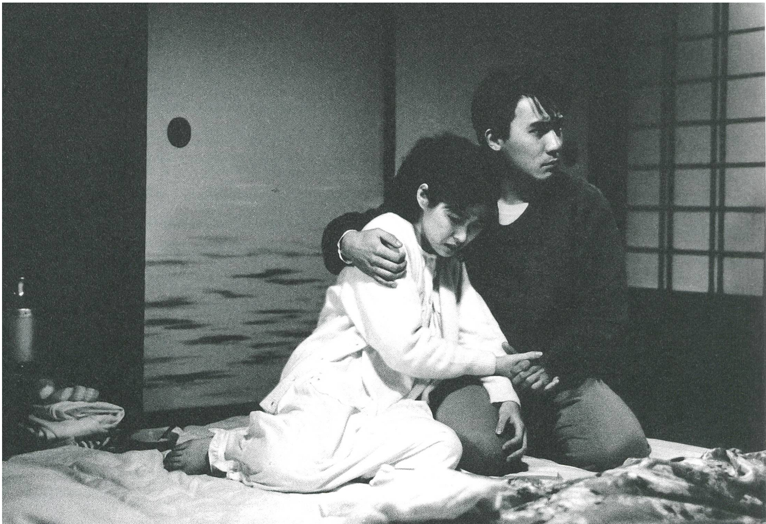
A City of Sadness (1989) Geschichte, Politik, Erinnerung und Alltag