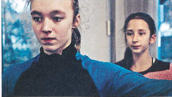
Eismädchen Regie: Lin Sternal