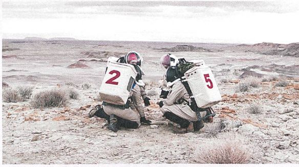
Above and Below Regie: Nicolas Steiner