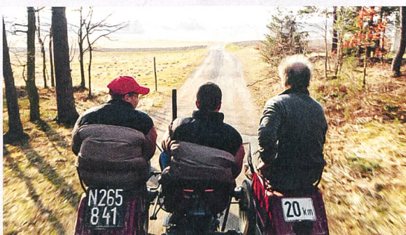
Über die Jahre Regie: Nikolaus Geyrhalter

eines Forschungsgeländes, das marsähnliche Verhältnisse simuliert. Steiner vergleicht seine Helden mit «Cowboys, Ghosts und Aliens» und stellt damit einen jeden von ihnen in einen aus dem Kino vertrauten Genrekontext. Scope-Format und Kranfahrten, Sounddesign und Score, gelegentlich auch Musikclip-Einlagen – die filmischen Mittel bezeugen alle den Kinoanspruch des Regisseurs mit einer schon jetzt erkennbaren Tendenz zum Spielfilm. Above and Below , zwei Stunden lang, ist seine Abschlussarbeit an der Filmakademie Baden-Württemberg.