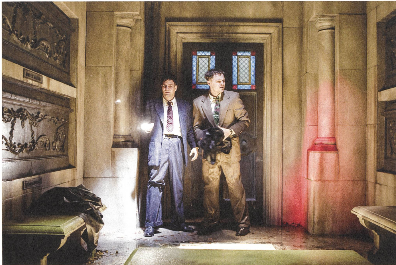
Mark Ruffalo und Leonardo DiCaprio in Shutter Island (2010), Regie: Martin Scorsese