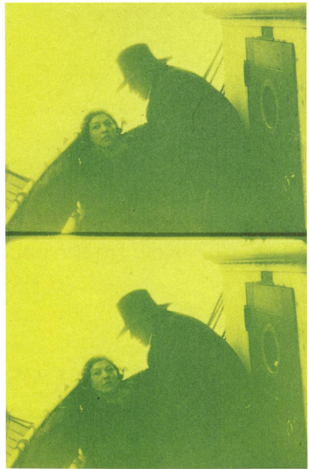
Richard Wagner (1913) Regie: Carl Froelich