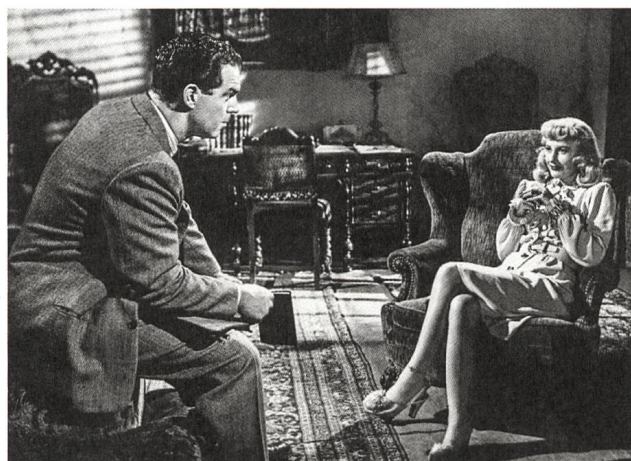
Double Indemnity (1944) Regie: Billy Wilder

S. 37 Demain / Tomorrow Cyril Dion, Mélanie Laurent von Irène Unholz