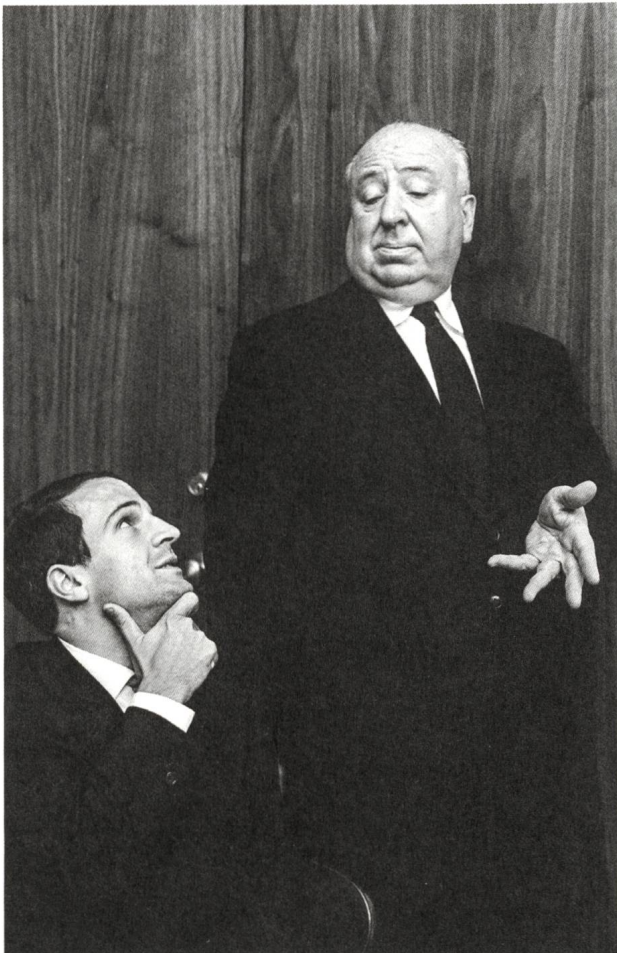
Hitchcock/Truffaut (2015) Regie: Kent Jones