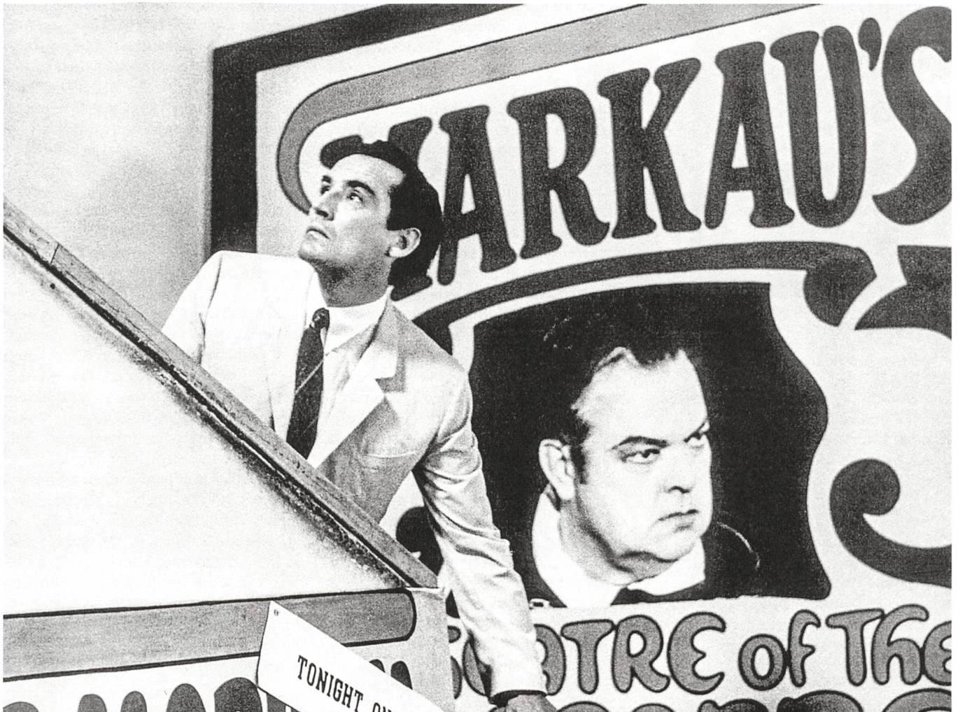
Twelve Plus One (1969) Vittorio Gassman