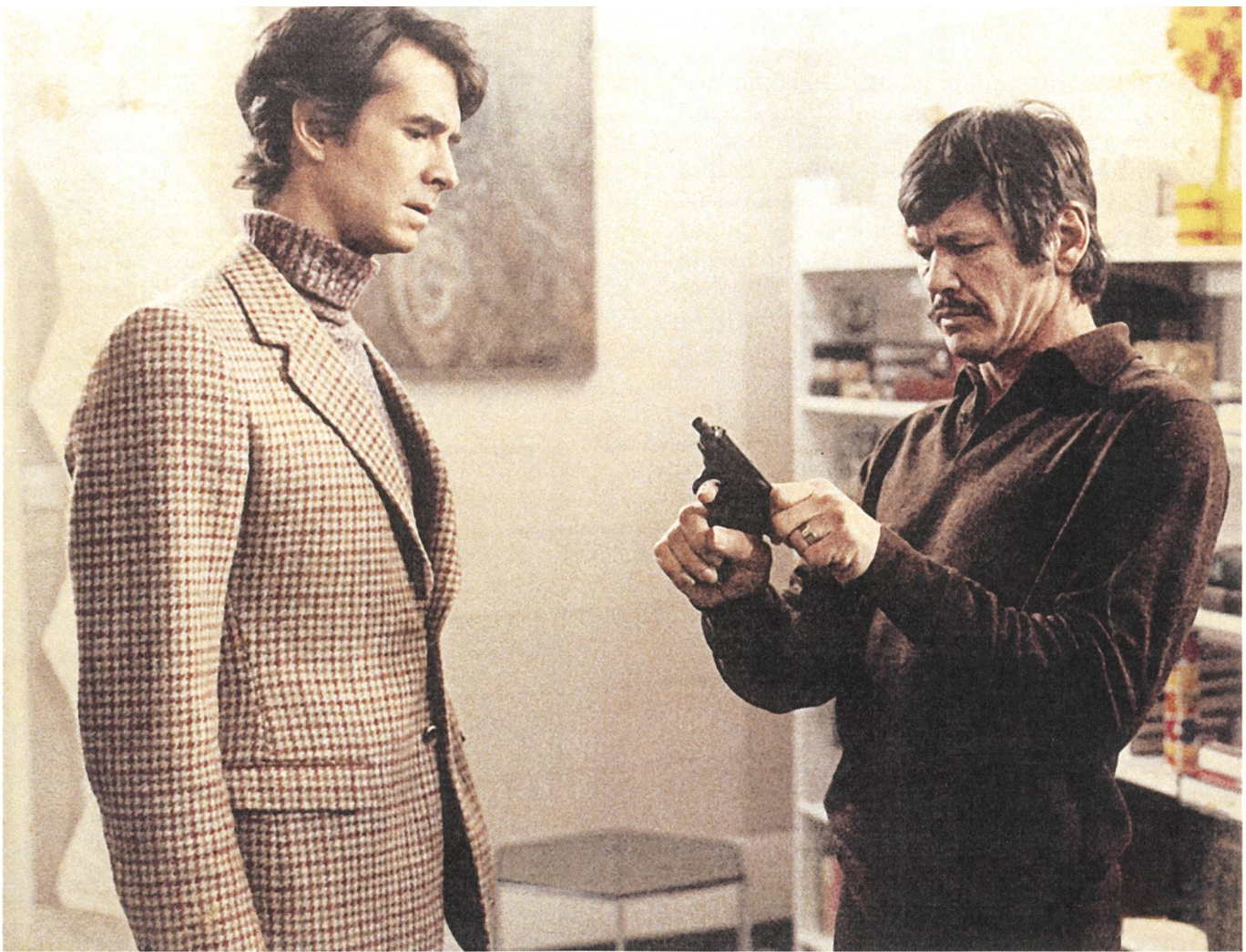
Someone Behind the Door (1971) Anthony Perkins und Charles Bronson