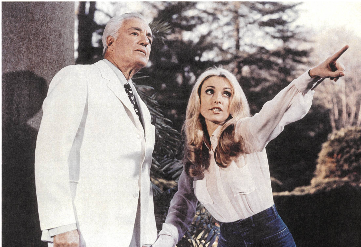
Twelve Plus One (1969) Vittorio de Sica und Sharon Tate

Manchmal war das Gegenteil der Fall: In Someone Behind the Door liess ich Anthony Perkins Charles Bronson gegenüberreten. Perkins spielte einen verschlagenen Neurochirurgen, der Bronson manipuliert und reinlegt. Bronson leidet an einer Amnesie, ist langsam, nicht sehr hell, aber kräftig und bedrohlich. Seine Figur musste ständig vor Perkins auf der Hut sein. Und diese konfliktbeladene Beziehung reproduzierte sich auch auf dem Set! Wenn ich mit Anthony Perkins sprach, beobachtete uns Bronson immer argwöhnisch und fragte sich, was wir beide wieder gegen ihn ausheckten. Bald wurde mir klar, dass mir diese Situation half, die Konflikte auf die Leinwand zu bringen.