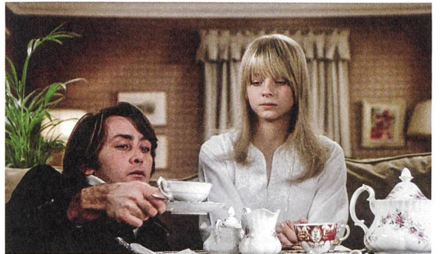
The Little Girl Who Lives Down the Lane