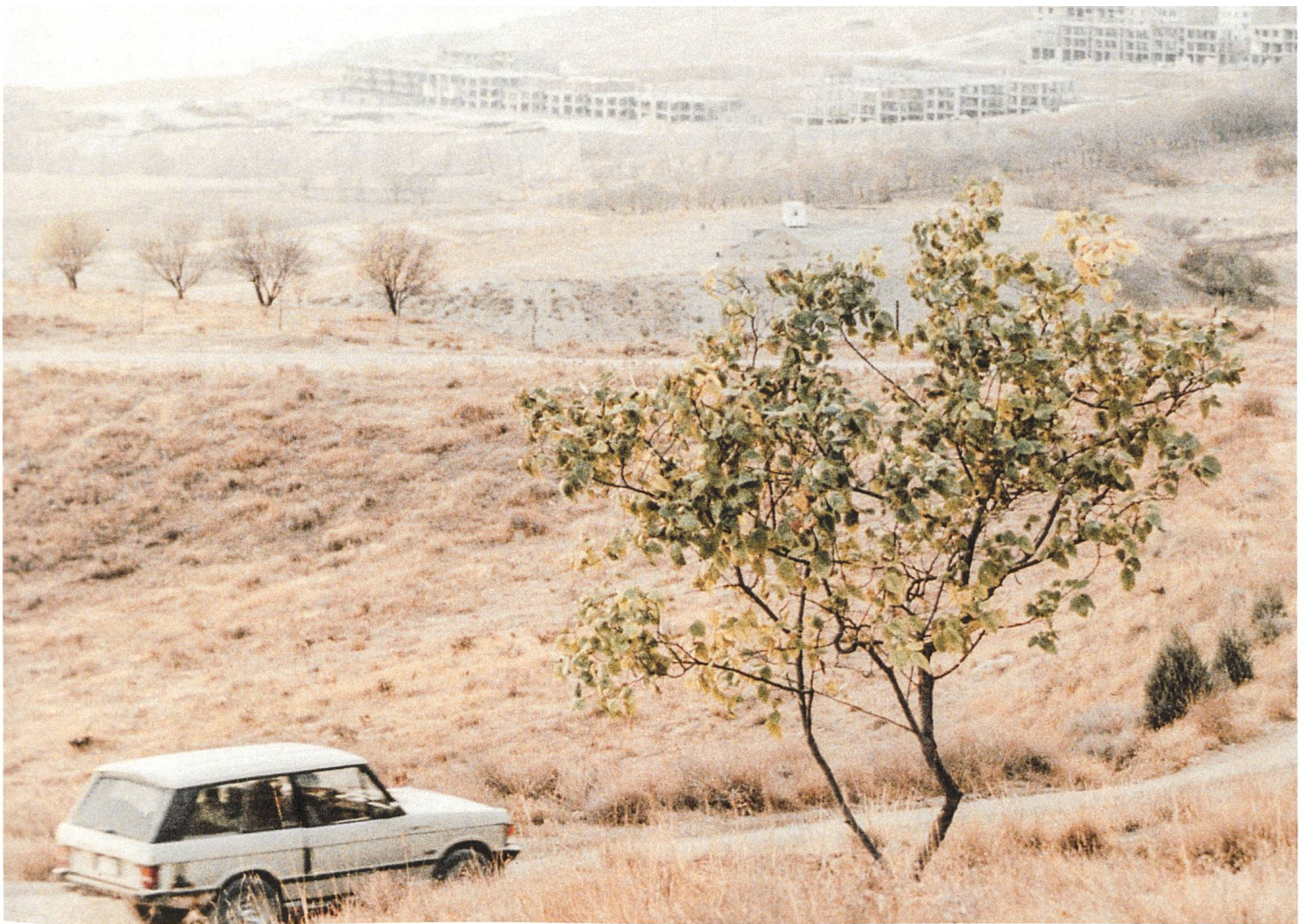
Le goût de la cerise / Ta'm e guilass (1997) Regie: Abbas Kiarostami

My car's my best friend. My office. My home. My location. I have a very intimate sense when I am in a car with someone next to me.