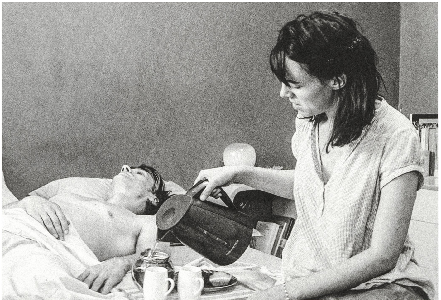
L'ombre des femmes Regie: Philippe Garrel