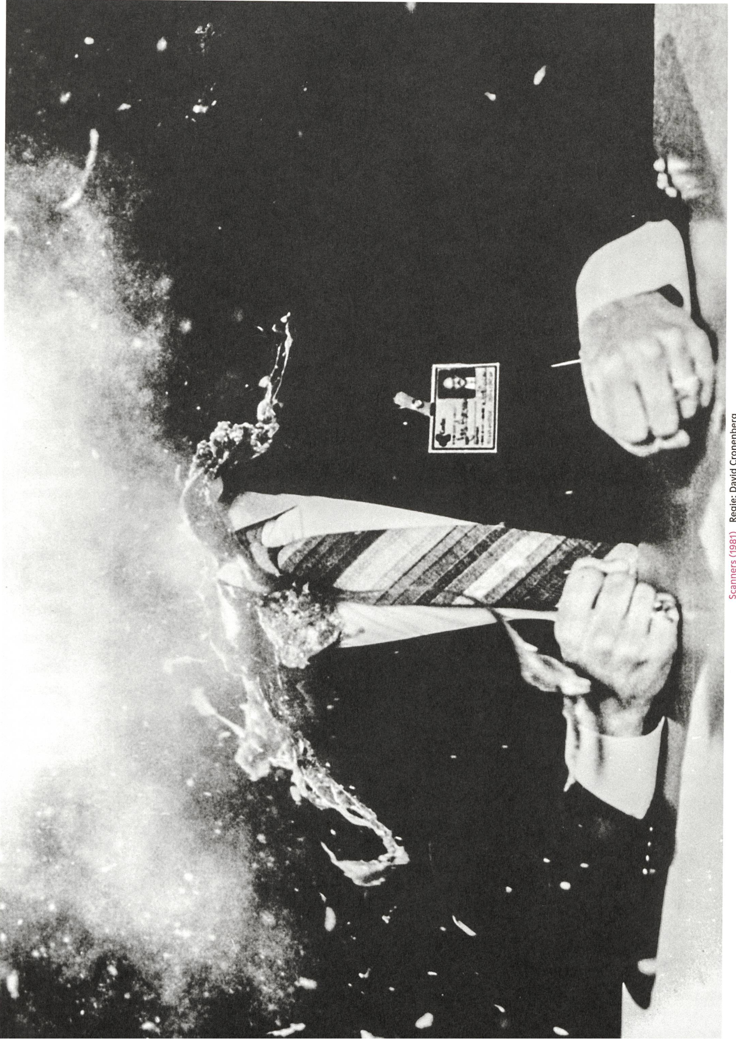
Scanners (1981) Regie: David Cronenberg