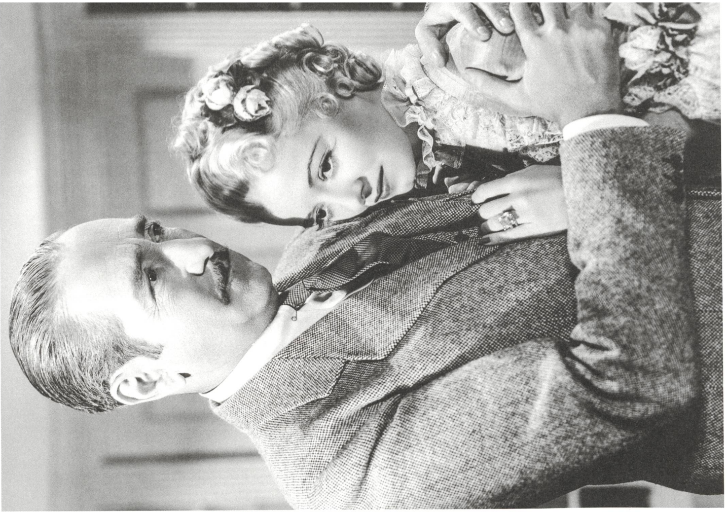
A Star Is Born (1937) Regie: William A. Wellman, Adolphe Menjou und Janet Gaynor