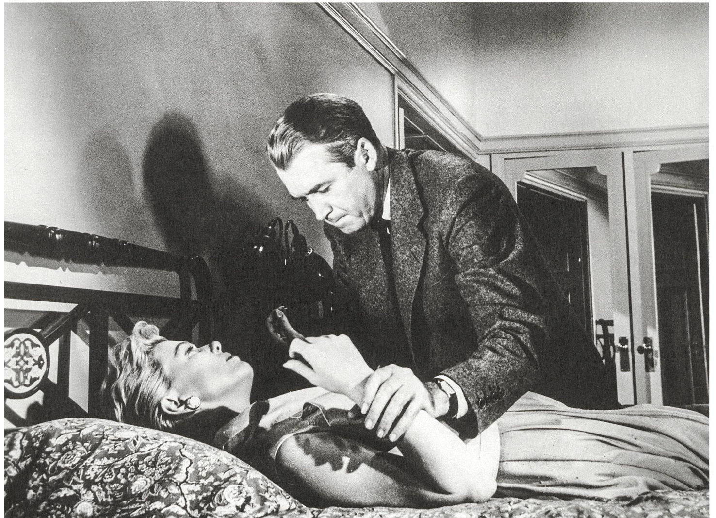
The Man Who Knew Too Much (1956) Regie: Alfred Hitchcock, Doris Day und James Stewart