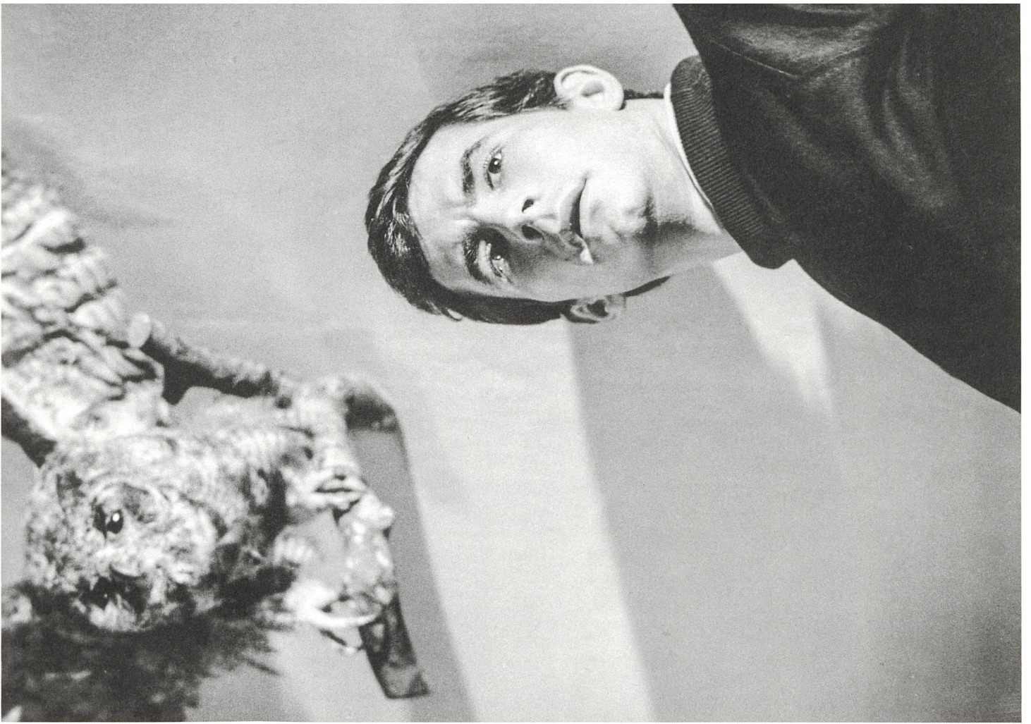
Psycho (1960) Regie: Alfred Hitchcock, Anthony Perkins als Norman Bates