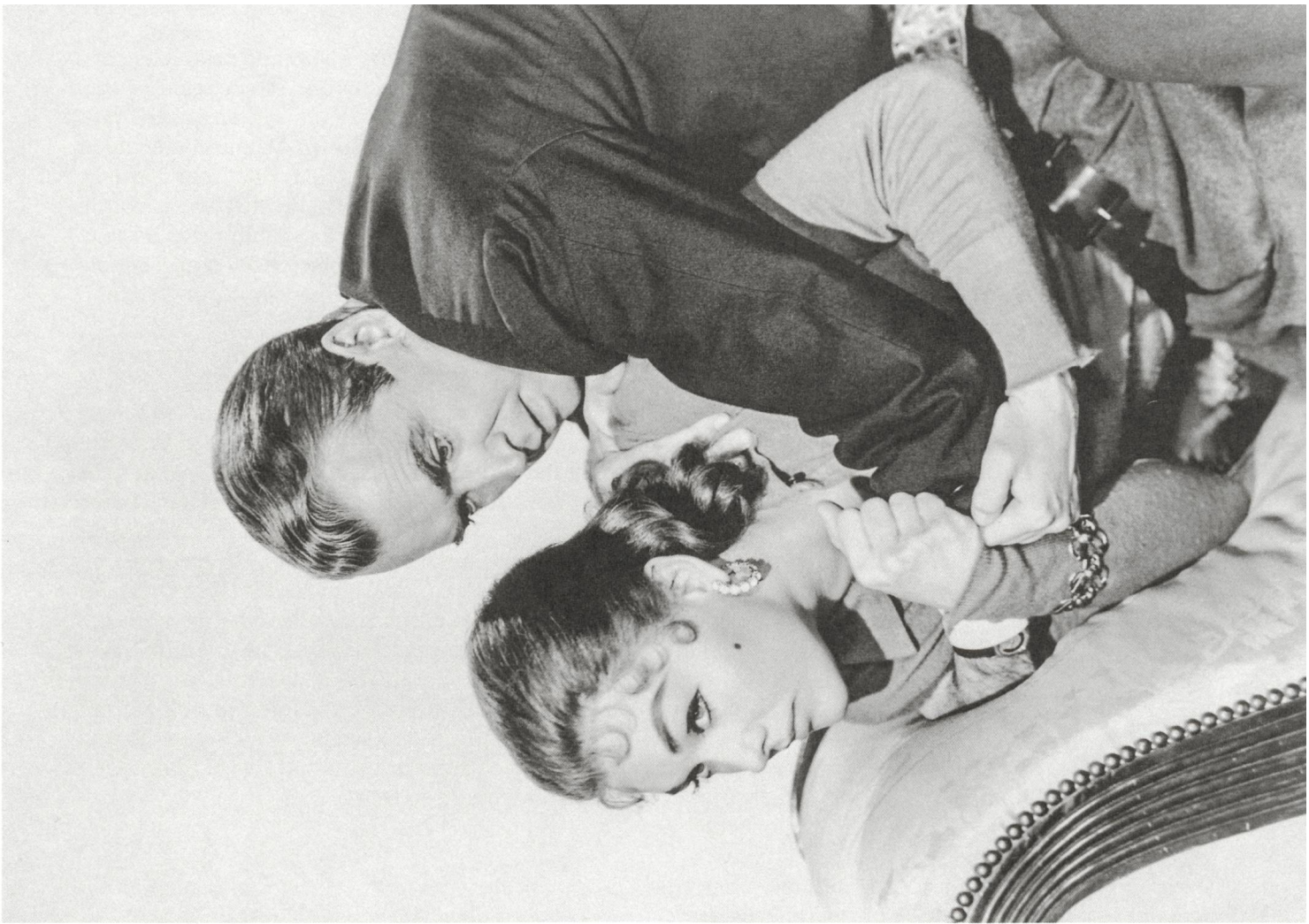
Vertigo (1958) Regie: Alfred Hitchcock, Kim Novak als Judy und James Stewart als Scottie