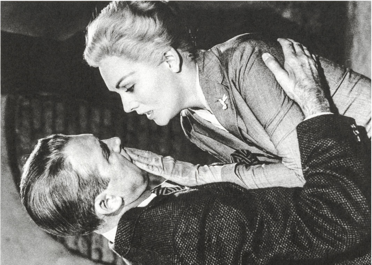
Vertigo (1958) Regie: Alfred Hitchcock, James Stewart als Scottie und Kim Novak als Madeline