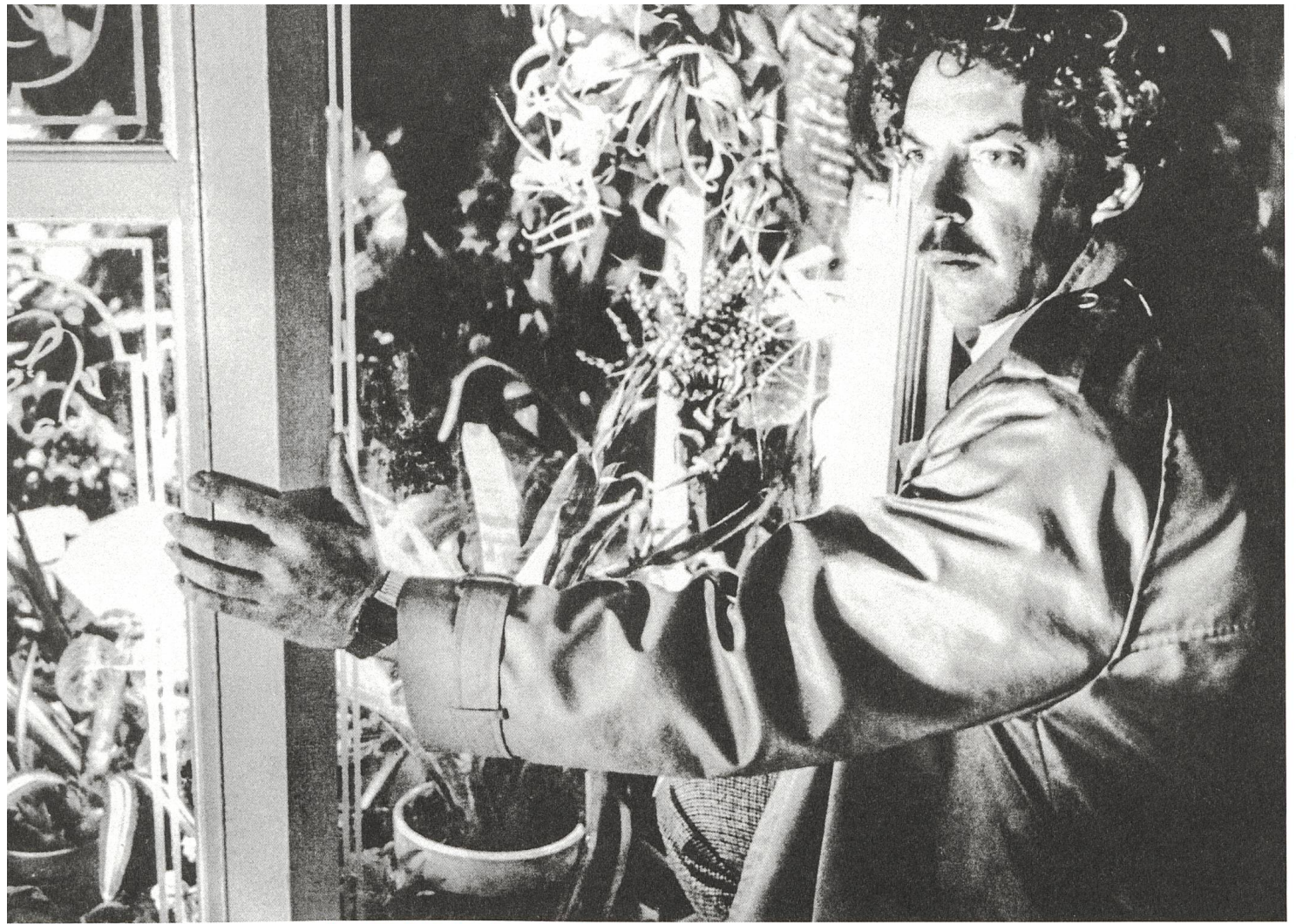
Invasion of the Body Snatchers (1978) Donald Sutherland als Matthew Bennell