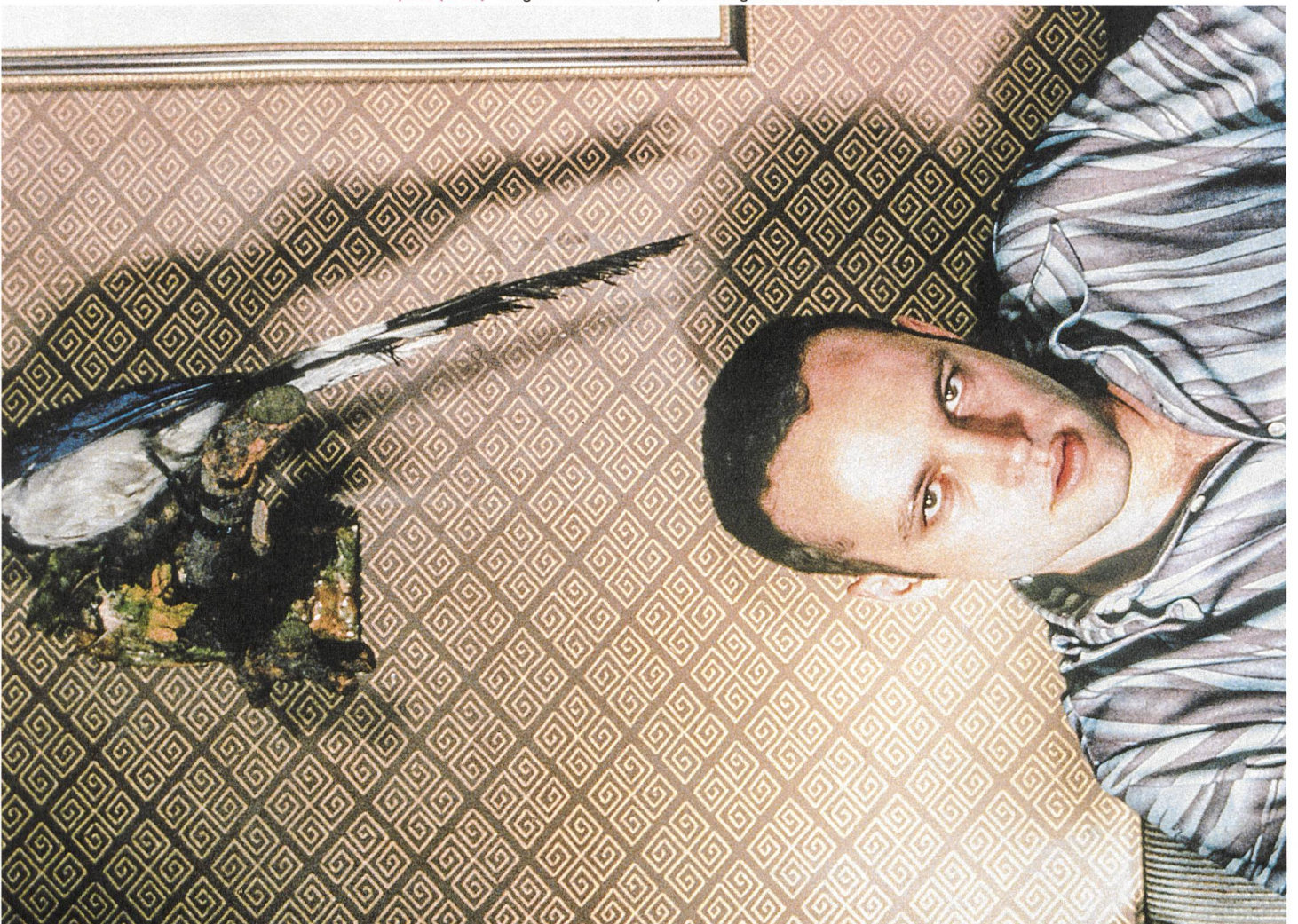
Psycho (1998) Regie: Gus Van Sant, Vince Vaughn als Norman Bates