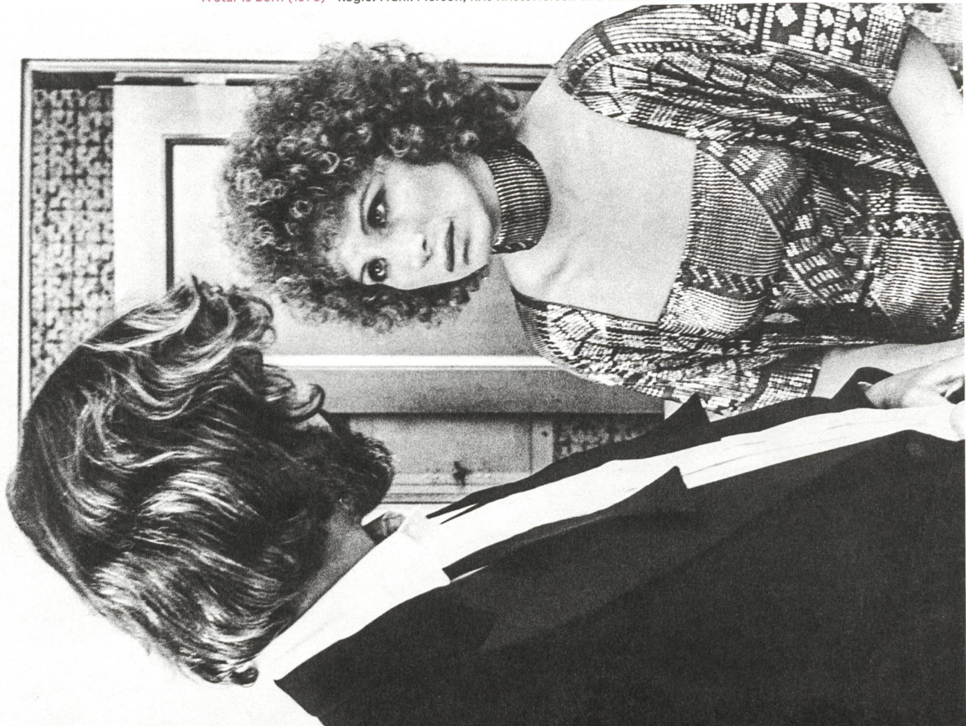
A Star Is Born (1976) Regie: Frank Pierson, Kris Kristofferson und Barbra Streisand