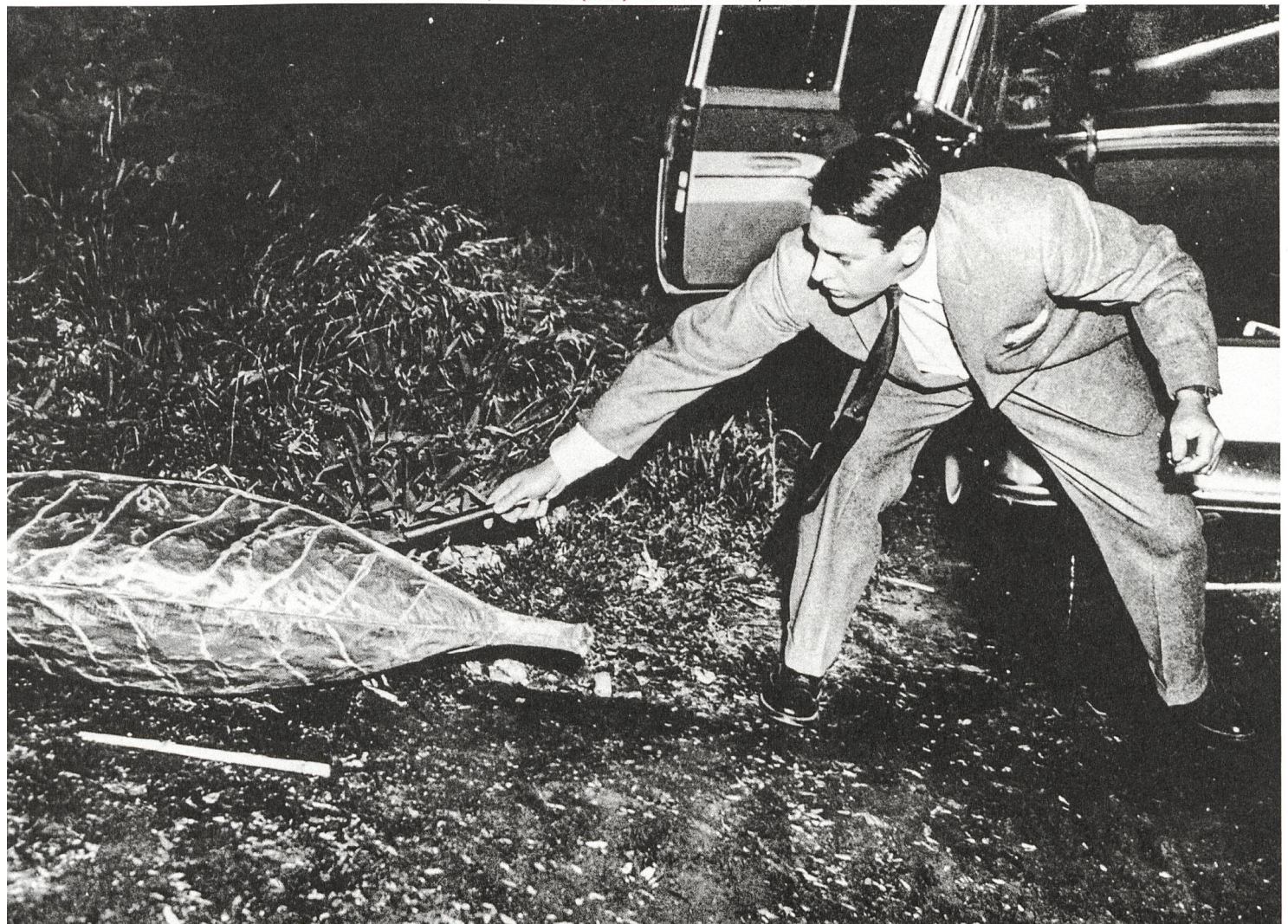
Invasion of the Body Snatchers (1956) Kevin McCarthy als Dr. Miles J. Bennell