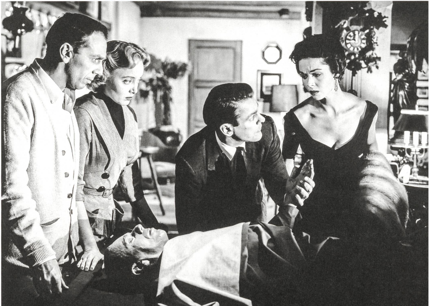
Invasion of the Body Snatchers (1956) Regie: Don Siegel, King Donovan, Carolyn Jones, Kevin McCarthy, Dana Wynter